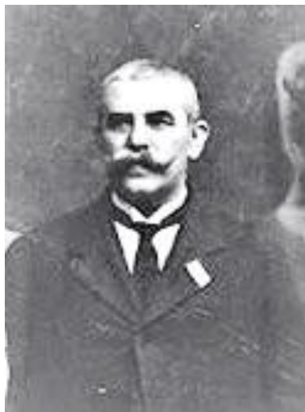
SOLOMON HALIȚĂ în zilele Marii Uniri de la 1918