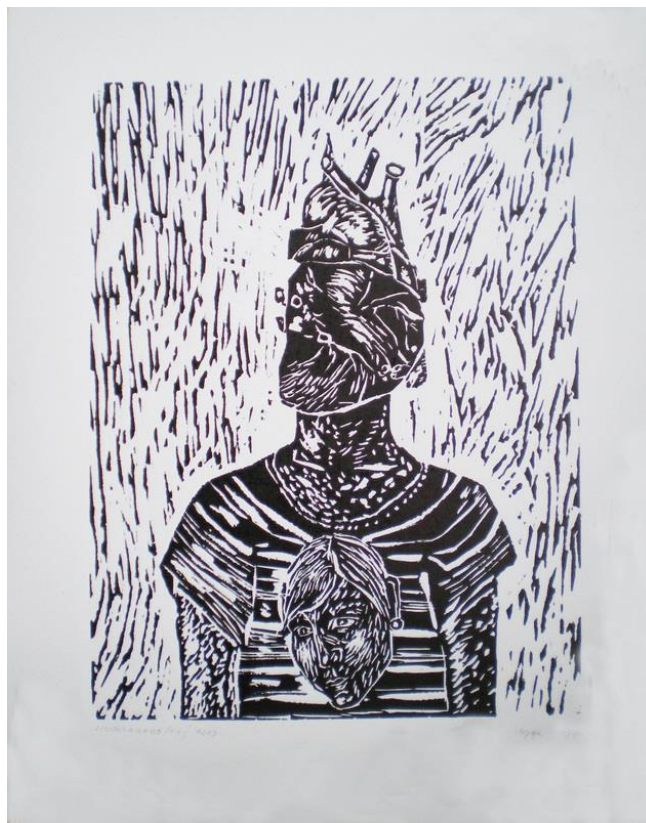
Lucrare aparținând artistei Mirela Joja

Dedic această apariție în revista „Pisani Sângeorzene” tatălui meu care a iubit cel mai mult locurile natale, colinele Sângeorzului și, care, astăzi, se odihnește într-o veșnicie pe una din ele. Fără doar și poate, a reușit să îmi transmită și mie aprecierea pentru locul natal, pentru natura, cu totul specială și pentru graiul local, de care mă voi bucura mereu.