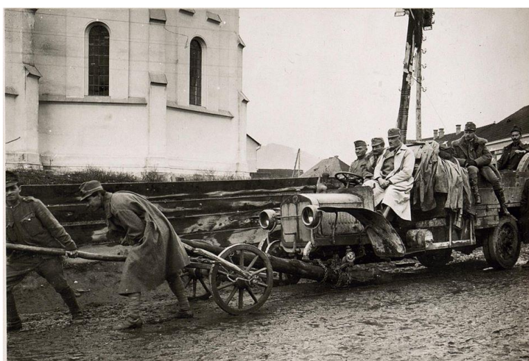
Accident auto în Telciu (1914-1918)