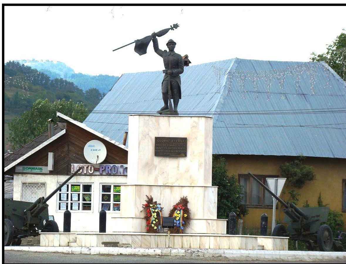
Monumentul Eroilor din comuna Telciu