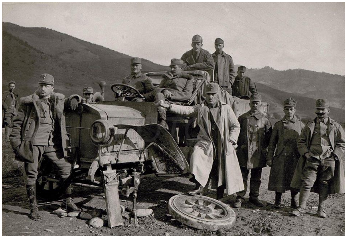
Accident auto în Telciu (1914-1918)