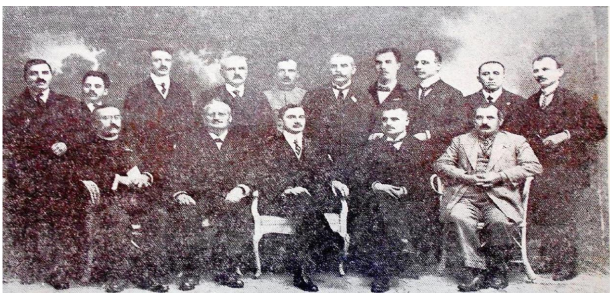
Consiliul Dirigent al Transilvaniei, Banatului și părților românești din Ungaria.

Victoria va veni. Suntem singuri. Pentru că solidaritatea românilor transilvani este limpede și viguroasă 1 .