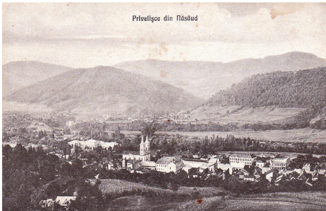
NASAUD - vedere generală cu Școala Primară, Palatul Primăriei, Biserica Greco-Catolică și Gimnaziul greco-catolic din Năsăud Carte poștală editată de I. Kahan în Năsăud, nedată, necirculată