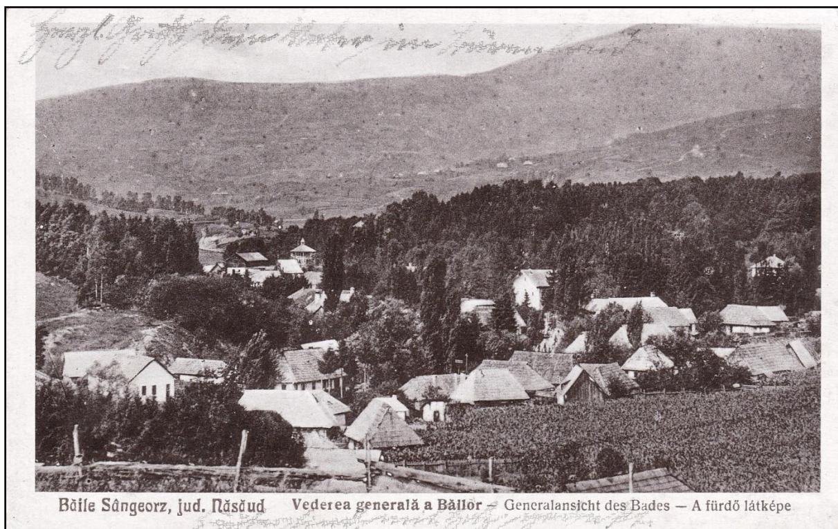
Băile Sângeorz, jud. Năsăud Vederea generală a Băilor – Generalansicht des Bades – A fürdő látképe