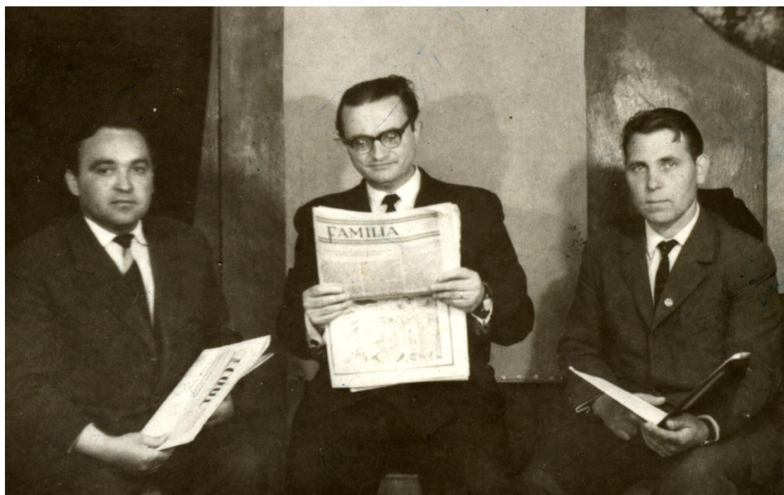
Membri ai cenaclului din Sângeorz-Băi