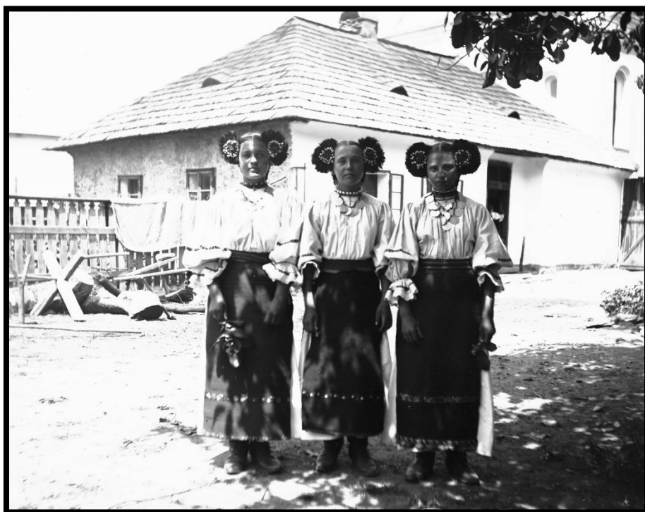
Trei fete din Sângeorz-Băi

de Romulus Vuia - Muzeul Etnografic al Transilvaniei, Romania - CC BY-SA. https://www.europeana.eu/item/952/Culturalia_6b8cb743_6f47_4036_94a9_c9ae5c7932e1