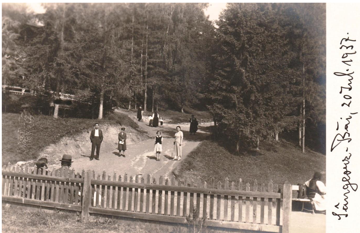
SÂNGEORZ-BĂI: Parcul cu aleea de la Izvorul nr.1 si 3; Fotografie datată 20.07.1937

Sângeorgiul are nevoie de un om. Dar un om cu vederi largi, cu perspective de viitor, hotărât și energic, care să curețe cu curaj rugina trecutului rudimentar și să ridice această stațiune la renume mondial, ceea ce se poate și trebuie să se facă, fără prea multă cheltuială, dar cu spirit de inițiative practice, pentru că darul lui Dumnezeu este aici mai îmbelșugat ca oriunde. Iar comuna, care se cramponează în tradițiile vremurilor de primitivă umilință, ar avea beneficii uriașe pe urma apelor ei miraculoase 1 .