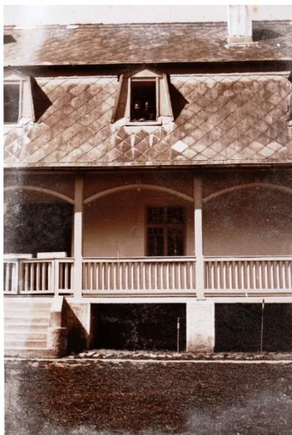
SÂNGEORZ-BĂI: Vila Mia; fotografie datată aprilie 1943

Aceste prețioase studii ale doctorilor Haliță și Popescu au darul să întărească și să ridice și mai mult prestigiul de care se bucură apele tămăduitoare ale acestui Vichy românesc, care este Sângeorzul năsăudean, unde în fiecare vară se abat suferinzi din toate colțurile țării și de unde pleacă vindecați de bolile care le pune la grea încercare sănătatea 1 .