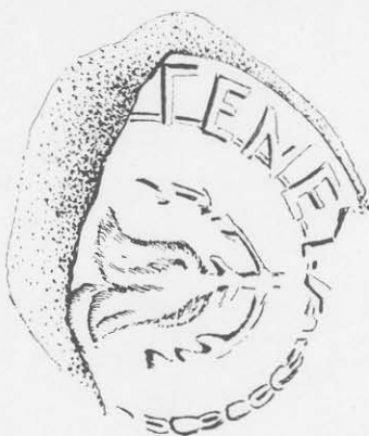
Toarta nr. 5.

Dat fiind floarea de rodie, simbol caracteristic, atribuim și această toartă unui atelier rhodian.