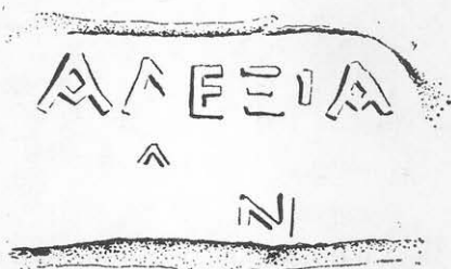
Toarta nr. 3.

Totuși cele două ștampile, cum ușor se poate observa, nu sînt identice, la prima, rîndul al doilea are trei litere (αδα), la a doua, numai două (δα).