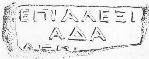
Toarta nr. 2.