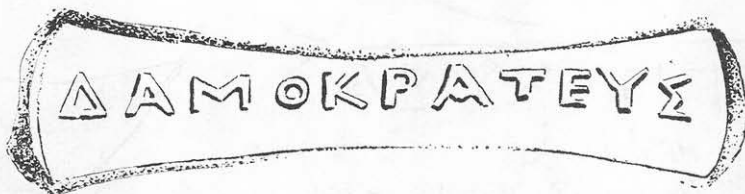
Toarta nr. 4.

Numele Δαμοκράτης apare în lista producătorilor rhodieni (la V. Canarache, nr. 515, 516, 517). Pentru această ștampilă, datarea e greu de stabilit.