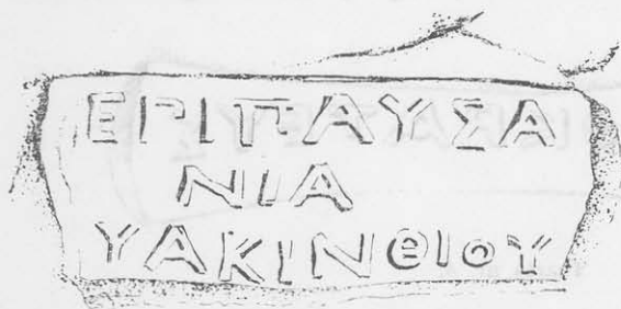
Toarta nr. 1

În traducere: pe timpul lui Pausanias, în luna Hyakinthios . La V. Canarache ( Importul de amfore la Histria ), magistratul eponim Πανσανία figurează în lista magistraților rhodieni (nr. 588), iar la Pauly-Wissowa, RE , datat între 180—150 î.e.n.