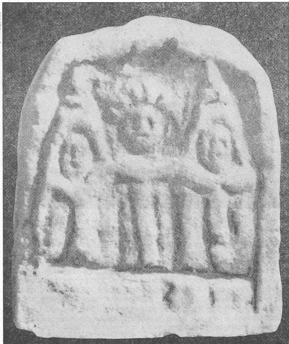
Fig. 2. Teritoriul orașului Callatis . Placă din marmură. Muzeul din Ploiești.

Nu este intenția noastră a face o expunere detaliată asupra numeroaselor probleme de natură iconografică și religioasă, suscitade de către