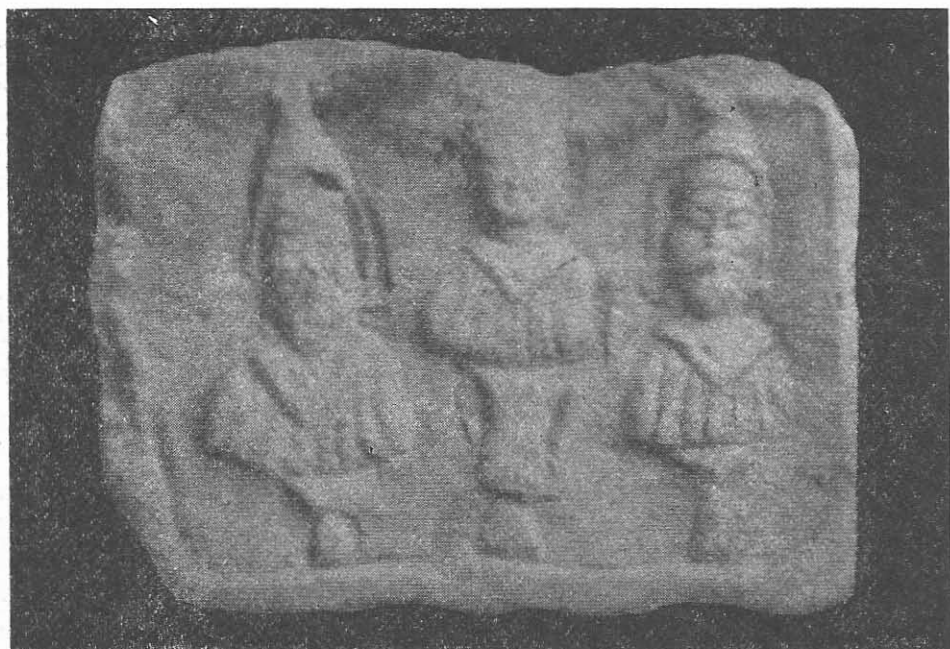
Fig. 3. Corbul de Jos. Relief din piatră. Muzeul de arheologie Constanța.

În primul rînd, apariția neașteptată a acestor patru tipuri de reliefuri numai pe teritoriul Dobrogei a determinat stabilirea unei noi