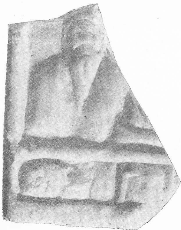
Fig. 4. Tomis . Fragment dintr-o tăbliță de marmură. Muzeul de arheologie Constanța.

vinităților. Asemenea elemente pe tăblițele danubiene apar iarăși numai în Dacia, la cele mai vechi reprezentări ale Cavalerilor danubieni, datate în secolul II e.n. cînd din punct de vedere iconografic, în această provincie, pentru prima dată și-a făcut apariția Cavalerul danubian nedublat 10 . Se constată de asemenea că atunci cînd în secolul al III-lea