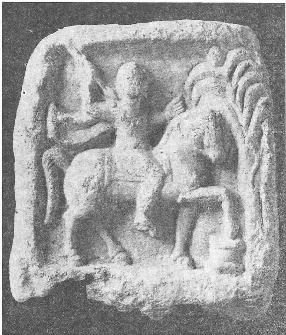
Fig. 6. Cavalerul Trac. Constanța. Sec. II—III e.n.

Scena prezintă pe Cavalerul Trac mergînd cu calul spre dreapta. Divinitatea este prezentată cu figura și torsul din față, iar piciorul drept din profil. Corpul este înveșmîntat într-o tunică scurtă, iar hlamida, prinsă în față cu o agrafă și trecută peste umeri, flutură în vînt. În mîna dreaptă, ridicată deasupra capului, Eroul ține o suliță scurtă. Cu mîna stîngă ridicată la înălțimea umărului, Cavalerul trage friul, întorcînd capul calului puțin spre dreapta.