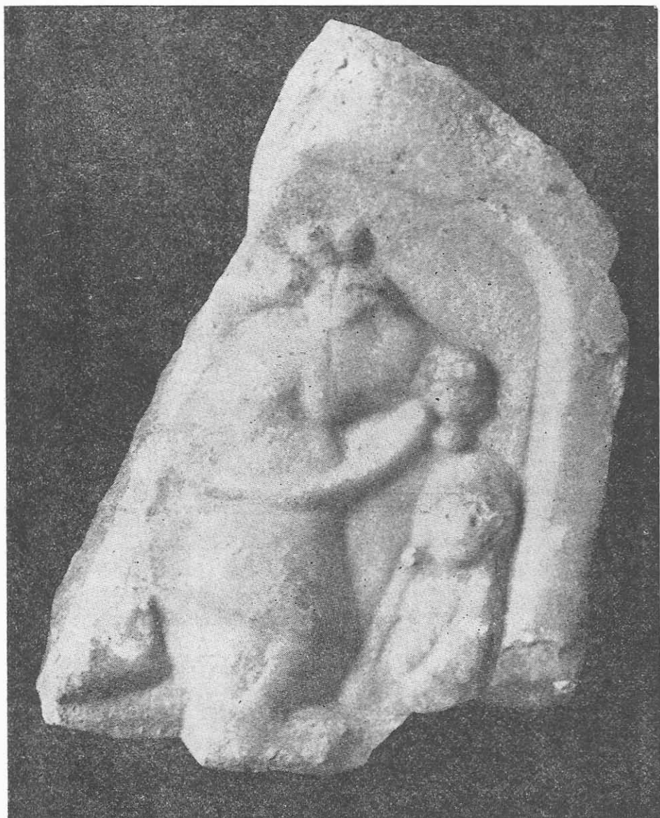
Fig. 7. Cavalerul Trac. Col. Slobozianu. Sec. II—III e.n.

Calul ține piciorul drept din față pe un altar rotund cu baza și partea superioară puțin profilate. Coama, deasă și scurtă, este redată prin linii incizate succesive. În același mod este realizată și coada lungă, puțin ridicată. Picioarele calului au fost lucrate bine, aproape perfect.