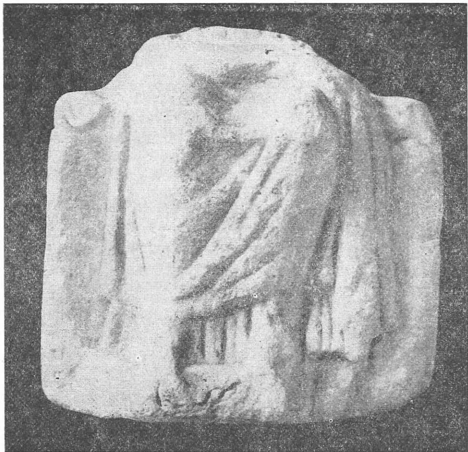
Fig. 2. Cybela. Mangalia. Epoca elenistică.

Cybela este așezată pe tron. Poartă chiton și himation care sînt mult drapate. Un voal coboară de pe umărul drept, trece peste genunchi și alunecă pe lingă piciorul stîng al zeiței.