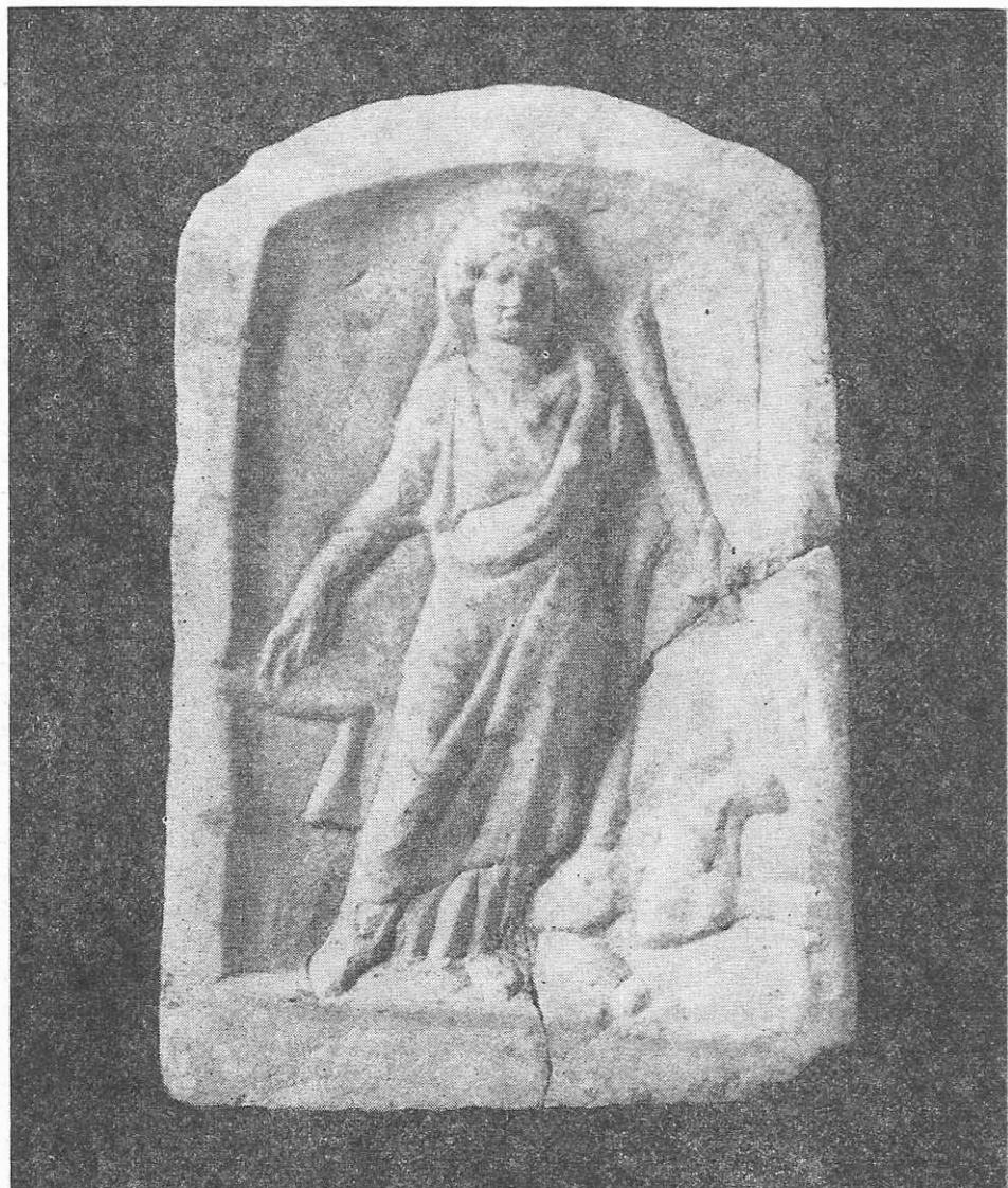
Fig. 5. Nemesis. Constanța. Sec. III e.n.

6. Cavalerul Trac (fig. 6). Constanța 24 . Inv. 17559. În. 0,240 m, lăț. 0,210 m, gros. 0,090 m. Basorelieful este lucrat din marmoră albă. Relieful este încadrat de un chenar mai lat la bază și subțiat pe celelalte laturi.