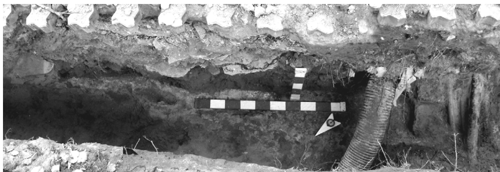
Fig. 2 - Cuptor de uz meșteșugăresc – b-dul Ferdinand, în dreptul imobilului nr. 28.