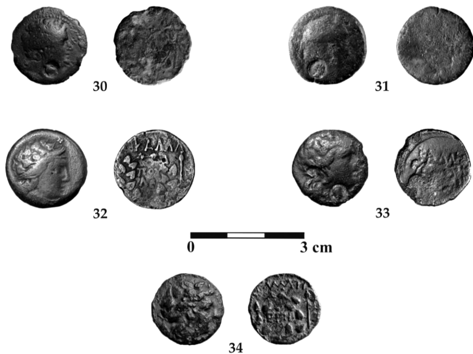
Pl. III - Noi descoperiri monetare preromane la Șipote (30-34).