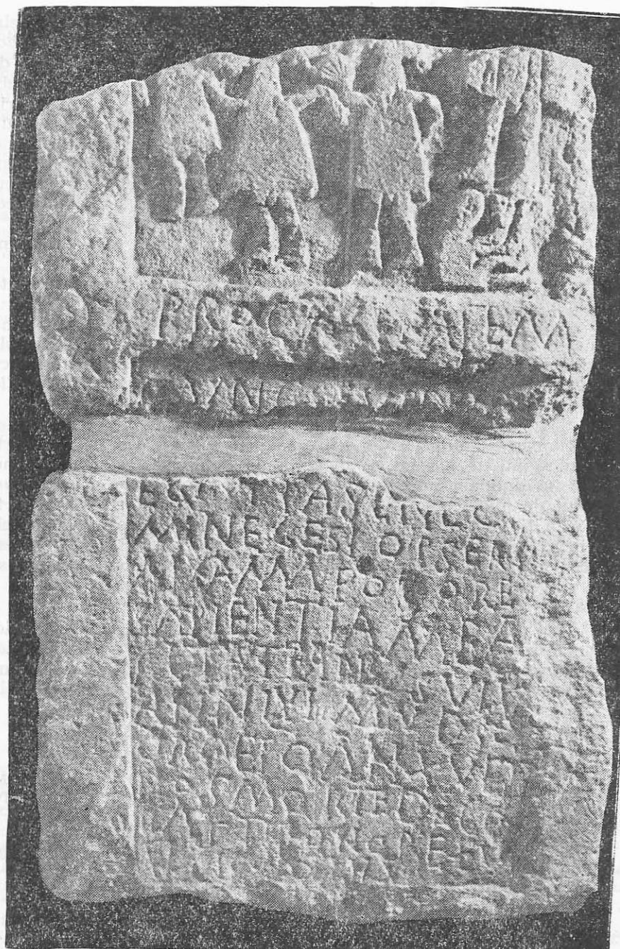
Fig. 2. Inscripție creștină din secolul al IV-lea.