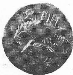
Planșa I. Drahme histriene descoperite recent în Dobrogea

Rv. ΙΣΤΡΙΗ ; vultur pe delfin spre stînga ; între aripile și coada vulturului sigla I.