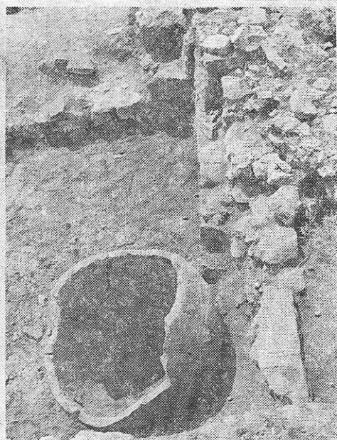
Fig. 4. Colțul de nord-est al încăperii din DC5.

Moneda descoperită în sondajul stratigrafic prezentat relevă și un alt aspect important din viața economică a așezării tropaeenilor din sec. al III-lea. Ea vine să completeze imaginea schimburilor economice pe care locuitorii de aici le realizau cu orașele grecești din sud 13 .