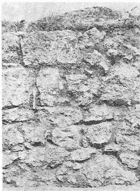
Fig. 3. Zid de sec. IV e.n.