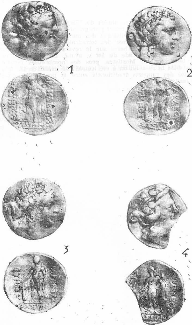
Plansa II. Tetrarahmele thasiene descoperite la Ulmu.