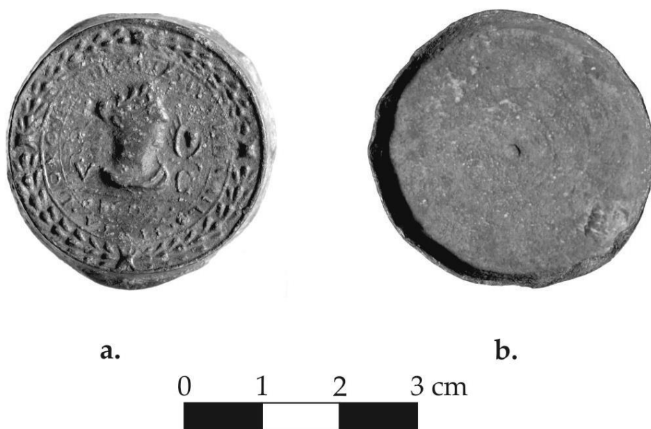
Fig. 1 – Capsulă de teriac descoperită la Vâlcele (Inv. 83349).