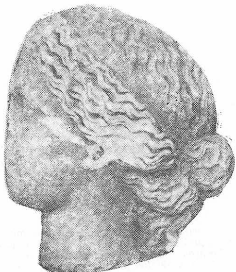
Fig. 2 — Venus. Profil stînga.

Părul ondulat este despărțit de o cărare mediană; două meșe laterale — formate din cîte cinci șuvițe mai mari (fig. 3) — sînt duse spre spate unde sînt prinse printr-un dublu coc, de forma unei funde, din care scapă cîțiva cîrlionți rebeli, de ambele părți. Deasupra celor două meșe, o panglică lată înconjoară capul și prinde părul la ceafă (fig. 4).