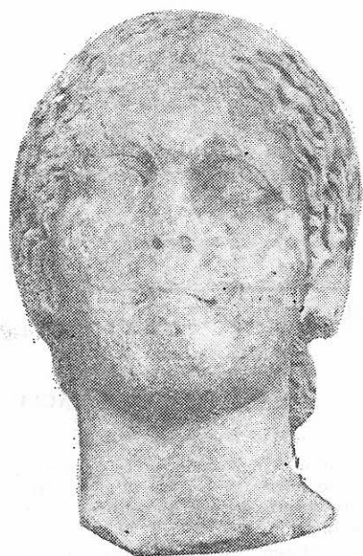
Fig. 1 — Venus. Marmură, str. Muzeelor.