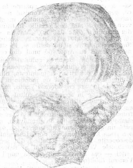
Fig. 8 — Venus. Spate.

4. A doua piesă este un portret mic, din bronz (în.: 0,046 m), foarte bine conservat, descoperit în anul 1961 pe str. Karl Marx 13 . Pieptănătura este tot cu krobylos și coc la ceafă, însă în loc de panglică, zeița poartă pe creștet o diademă.