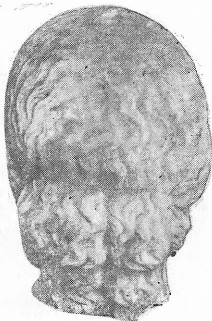
Fig. 4 — Venus. Spate.

vituri și zgîrieturi (lipsește partea stîngă din krobylos , vîrfurile nasului și buza de sus; zgîrieturi apar pe bărbie, pe obrazul drept, la ochi și la păr) nu ne împiedică să apreciem la justa sa valoare grația deosebită a portretului (fig. 5).