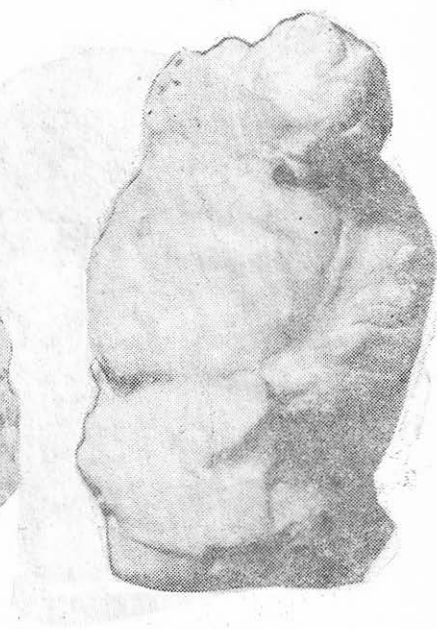
Fig. 6 — Venus. Spate.

3. Primul dintre acestea 10 , descoperit încă din anul 1960, a devenit cunoscut prin intermediul numeroaselor ghiduri și al ilustrațiilor publicitare 11 (fig. 7). În mărime naturală, este lucrat din marmură albă zaharoidă, șlefuită cu multă finețe. Lipsește krobylos -ul, bărbia și partea inferioară a obrazului stâng; nasul este lovit, și o fisură profundă îi brăzdează obrazul drept de la rădăcina nasului până la ureche. Cu toate aceste lipsuri, se evidențiază execuția minuțioasă, îngrijită a sculpturii. Pieptănătura, de tip Afrodita Capitolina 12 este realizată cu mai multă acuratețe decât la piesa precedentă (fig. 8).