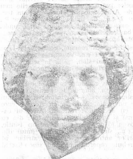
Fig. 7 — Venus. Marmură, str. Mircea.