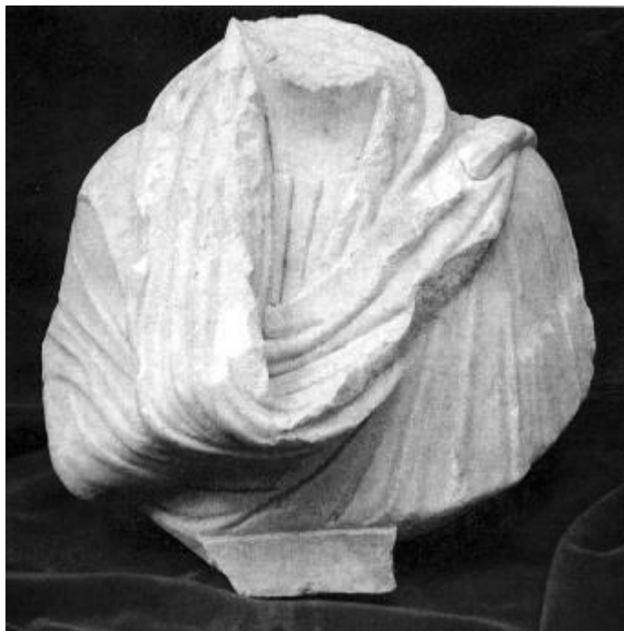
Fig. 1 – Bust masculin