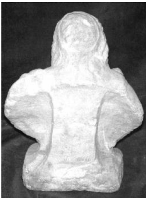
Fig. 3 – Bust-portret masculin