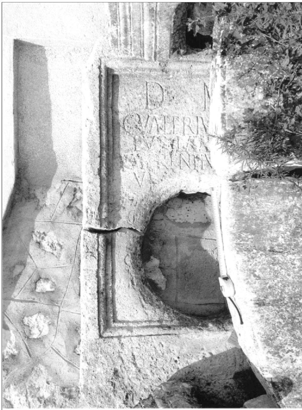
Fig. 2 - Fotografia pietrei de mormânt (stadiul din 29. 07. 2000)