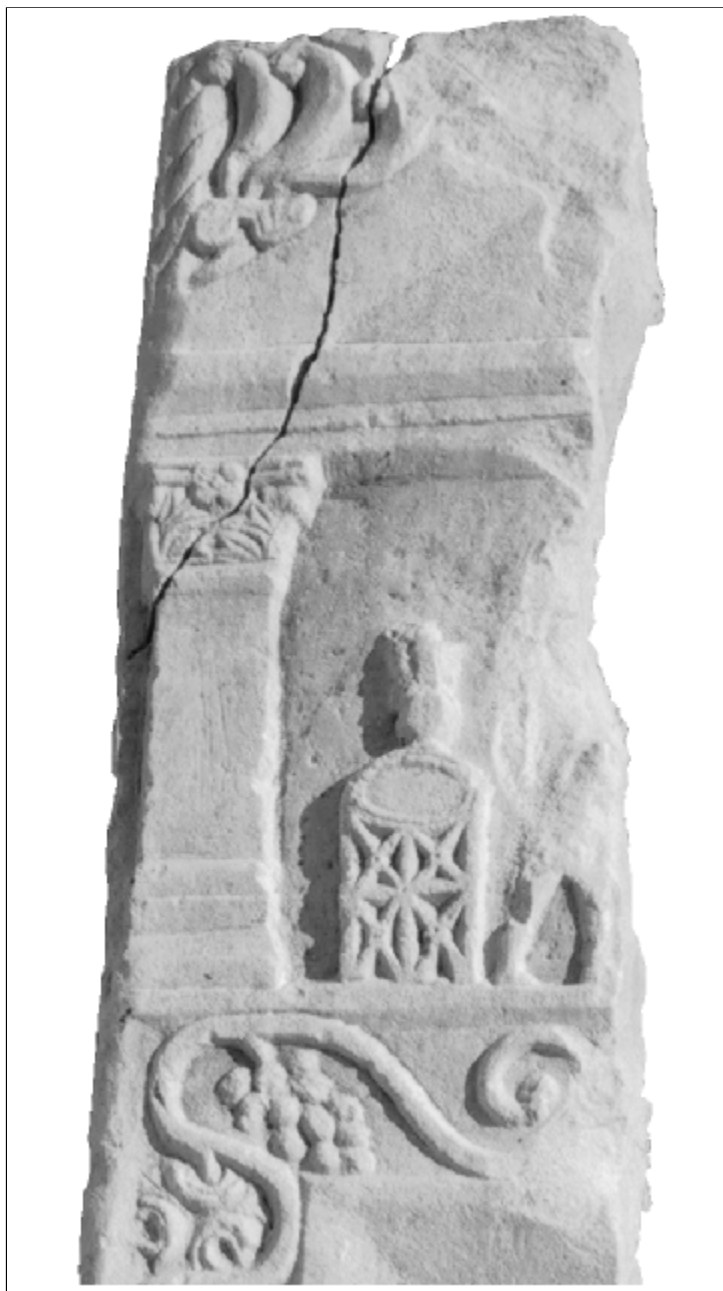
Fig. 1 – Detaliu artistic