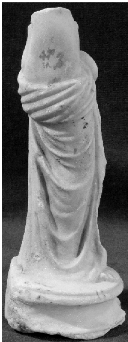
Fig. 2 – Venus cu Eros în brațe (profil dreapta)