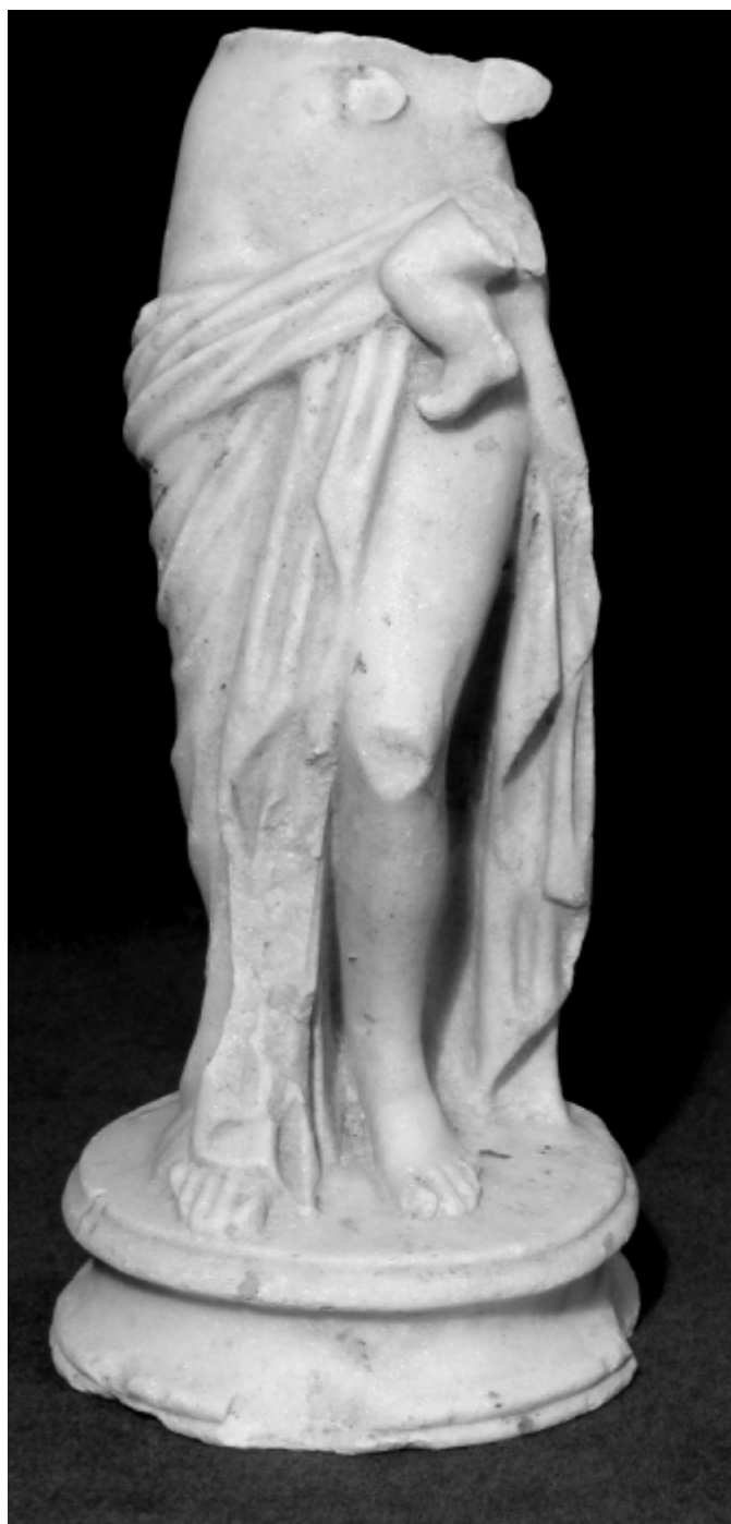
Fig. 1 – Venus cu Eros în brațe (vedere din față)