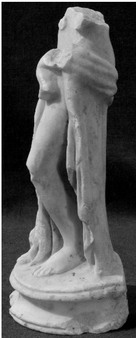
Fig. 4 – Venus cu Eros în brațe (profil stânga)