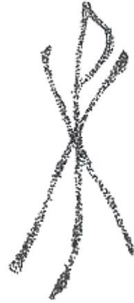
Monograma de la Hârșova.