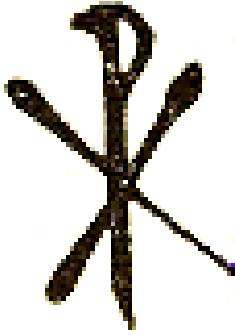
Numele lui Hristos pe monograma de la Barboși.