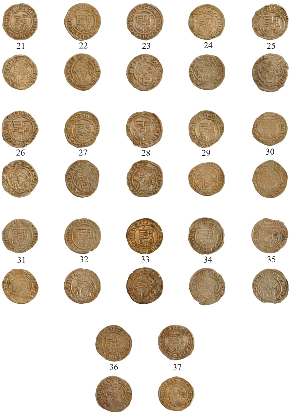
Planșa II. Monede din tezaurul descoperit la Slobozia.