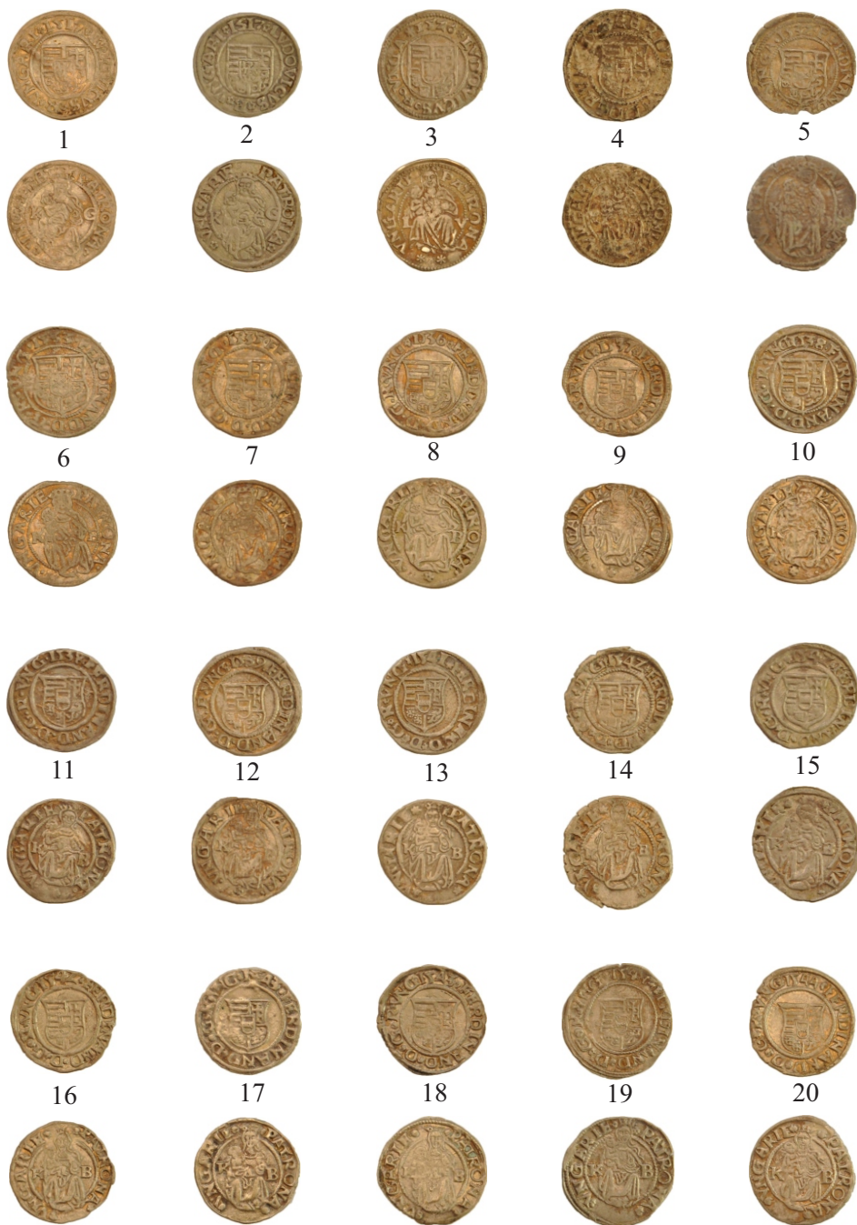
Planşa I. Monede din tezaurul descoperit la Slobozia.