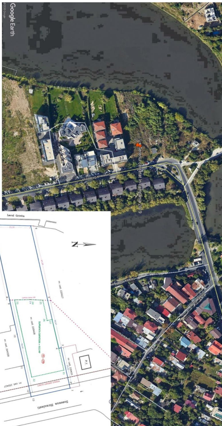
Planşa I. Amplasarea terenului cercetat în timpul campaniei 2019.