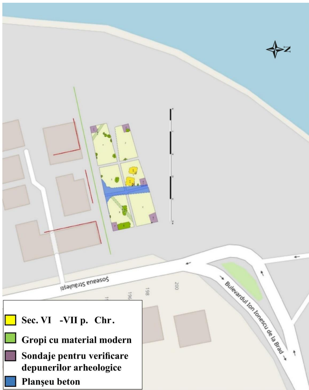
Planșa II. Planul cercetărilor arheologice, campania 2019.