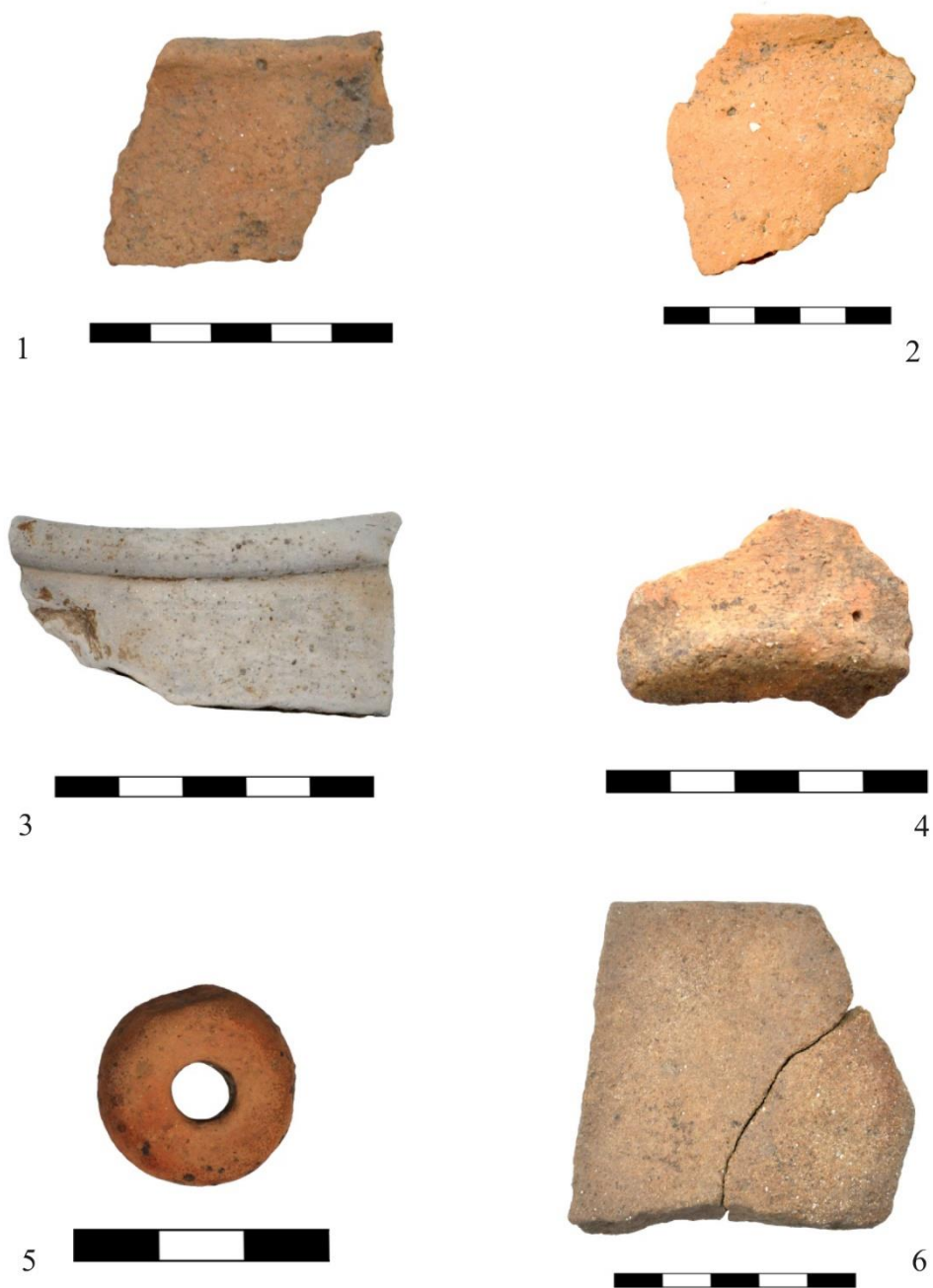
Planșa X. Locuința 1. Obiecte descoperite în umplutura locuinței (1-3, 5-6) și în cuptor (4): fragmente ceramice din secolele VI-VII p. Chr. (1-4); fusaiole (5); piatră de ascuțit (6).