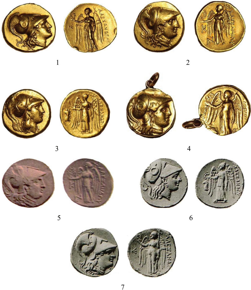
Planşa I. 1-4. Staterii de tip Alexandru cel Mare din colecția Mariei Golescu: 1. Kallatis (Price 897); 2. Kallatis (Price 914); 3. Sardes (Price 2533); 4. Babylon (Price 3748); 5. Stater tip Alexandru cel Mare din Kallatis (Price 914), licitația Hess, 15 octombrie 1903 (nr. 96); 6. Stater tip Alexandru cel Mare din Sardes (Price 2533), licitația Schlessinger, 4 februarie 1935 (nr. 656); 7. Stater tip Alexandru cel Mare din Kallatis (Price 897), licitația Schlessinger, 4 februarie 1935 (nr. 671).