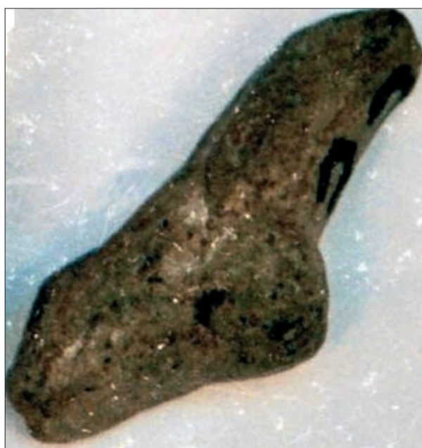
Fig. 3. Idol Criș de la Matei-„Staniște”.