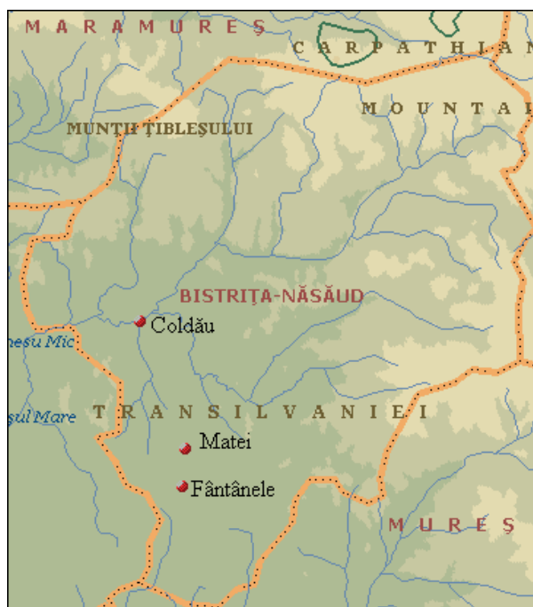
Fig. 1. Harta cu așezări Criș, de unde s-au publicat materiale Criș desenate și fotografiate.

Un alt idol am descoperit pe data de 10 ianuarie 2014 în așezarea Iclod de la Fântânele-„Braniște”, comuna Matei. Idolul de lut ars e plat, dar ușor curbat în față, elipsoidal în secțiune transversală (Fig. 2/4). Miezul idolului are culoare negru-cenușie-brun închisă-cenușie. Pe ultima culoare urmează o culoare brună, care la exterior are crustă de culoare brun deschisă. Deasupra brațului stâng, se află un petec cărămiziu, după cum se pare, așa era și dedesubtul brațului. Petecul cărămiziu era acoperit de un slip brun închis, lucios. Pe spate, culoarea idolului e brună, la suprafață având crustă brun deschisă. Degresanții au fost pleava și nisipul fin. Lățimea în partea superioară e de 32,1 mm, grosimea de 12,3 mm. De la capătul brațului stâng până la locul de unde pornea brațul drept, lățimea e de 39,2 mm. În partea de jos, lățimea e de 27,9 mm, grosimea de 12,5 mm. Înălțimea păstrată e de 25 mm. Pe vremuri, avea brațele întinse, azi brațul drept lipsește. De la brațe în jos se îngustează, probabil așa era și mai în sus de brațe. Brațul drept a fost