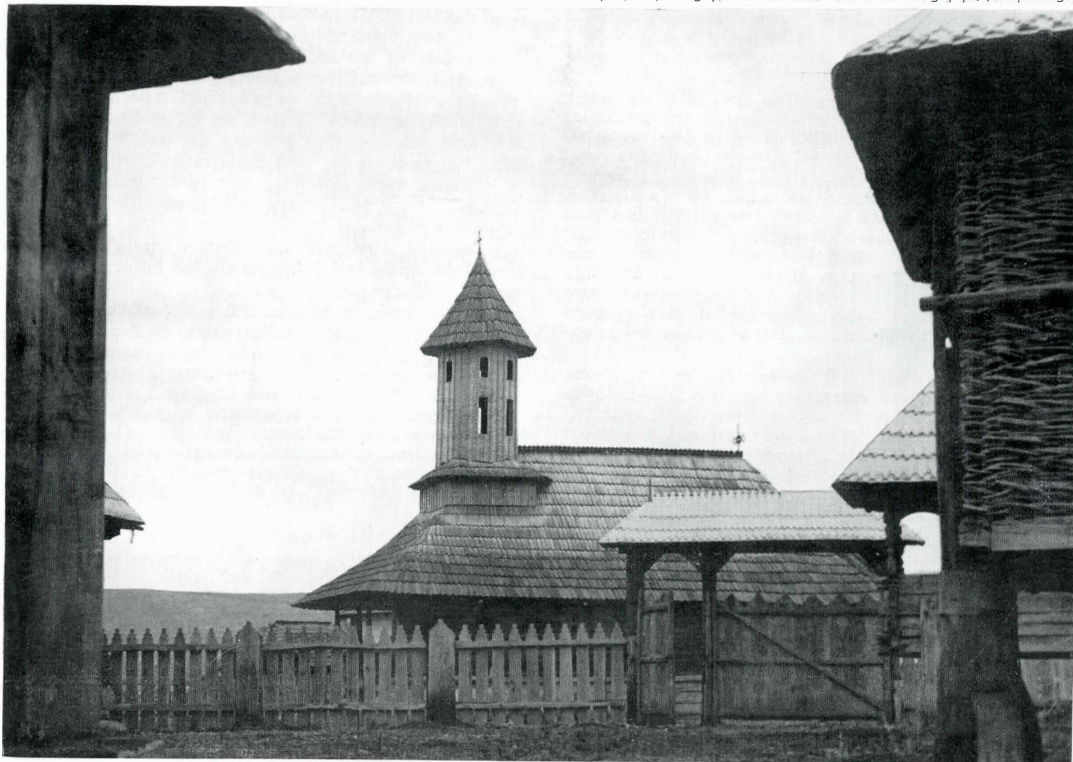
Fig. 7. Vedere parțială asupra Muzeului în aer liber din Golești, județul Argeș; în centru, biserica de la Drăguțești, județul Argeș.

Dacă punctul conservat „in situ” este menit să redea aspecte din înfățișarea satului altor epoci, ținînd cont de determinările, de realitățile social-istorice, atunci sîntem obligați să aducem amendamente, de exterior și în principal de interior, clișeul actual nefiînd conform cu cadrul uman, temporal și teritorial în care s-a produs. În acest caz, ne apropiem foarte mult de ceea ce se cheamă o lucrare cu caracter muzeografic. Va trebui procedat, așadar, la unele eliminări și adăugiri, respectînd ideea de bază, și anume aceea ca ele să nu afecteze decît în cazuri cu totul excepționale construcțiile principale (casa de locuit, gospodăria, împrejurimi, porți etc.) destinate a rămîne pe loc. În schimb, dacă un ansamblu (uliță, parte de sat) este deranjat de un element nou, străin de spiritul