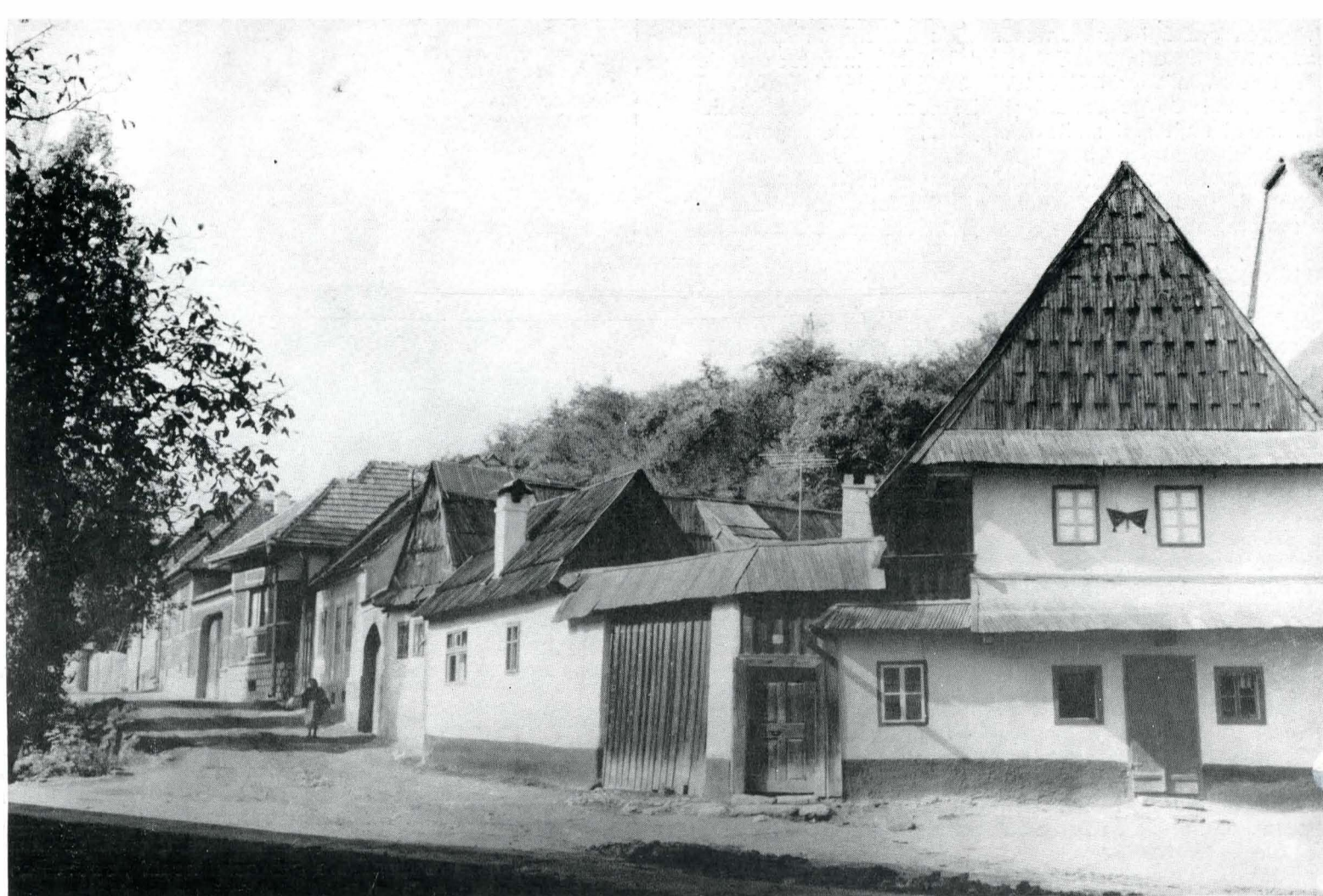
Fig. 3. Uliță pornind din centrul comunei Poiana Sibiului, județul Sibiu.

nal, urmează a se mobiliza pentru a marca, prin rezolvări concrete, o etapă calitativ superioară în dezvoltarea activității, în concordanță cu problemele majore ale societății contemporane și ale societății viitorului.