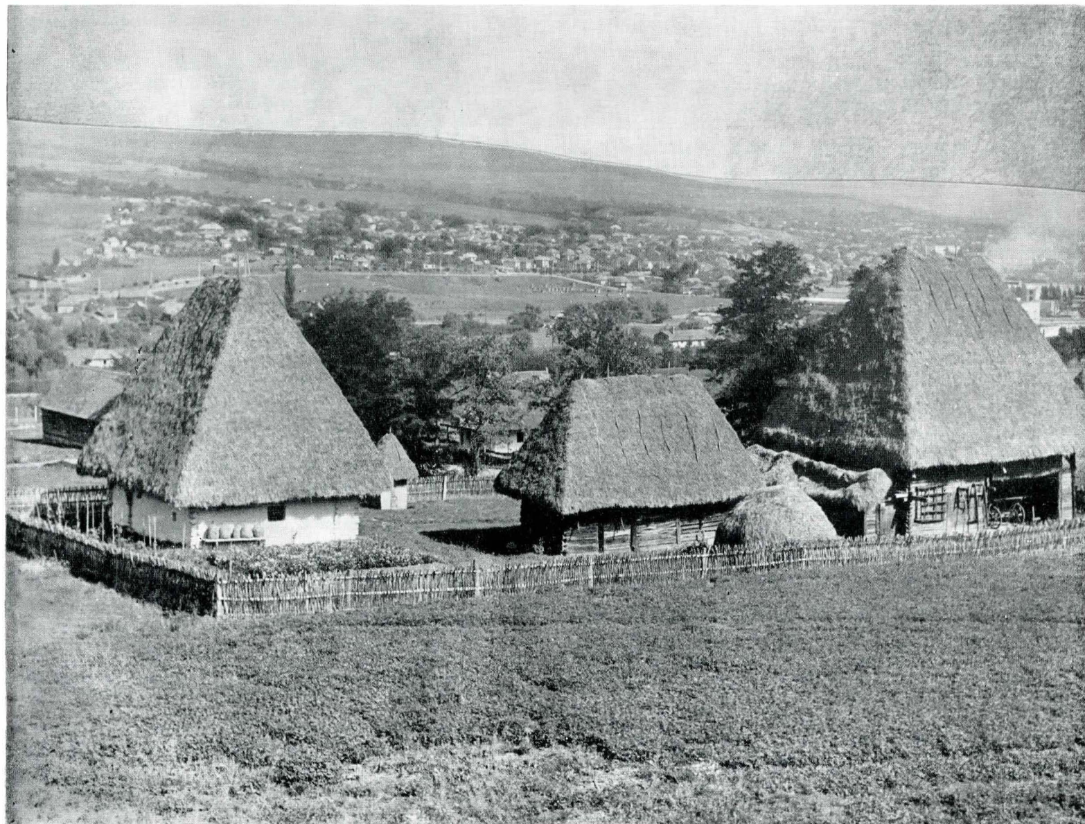
Fig. 1. Gospodărie din comuna Bedeci, județul Cluj, organizată în secția în aer liber a Muzeului etnografic al Transilvaniei, Cluj.