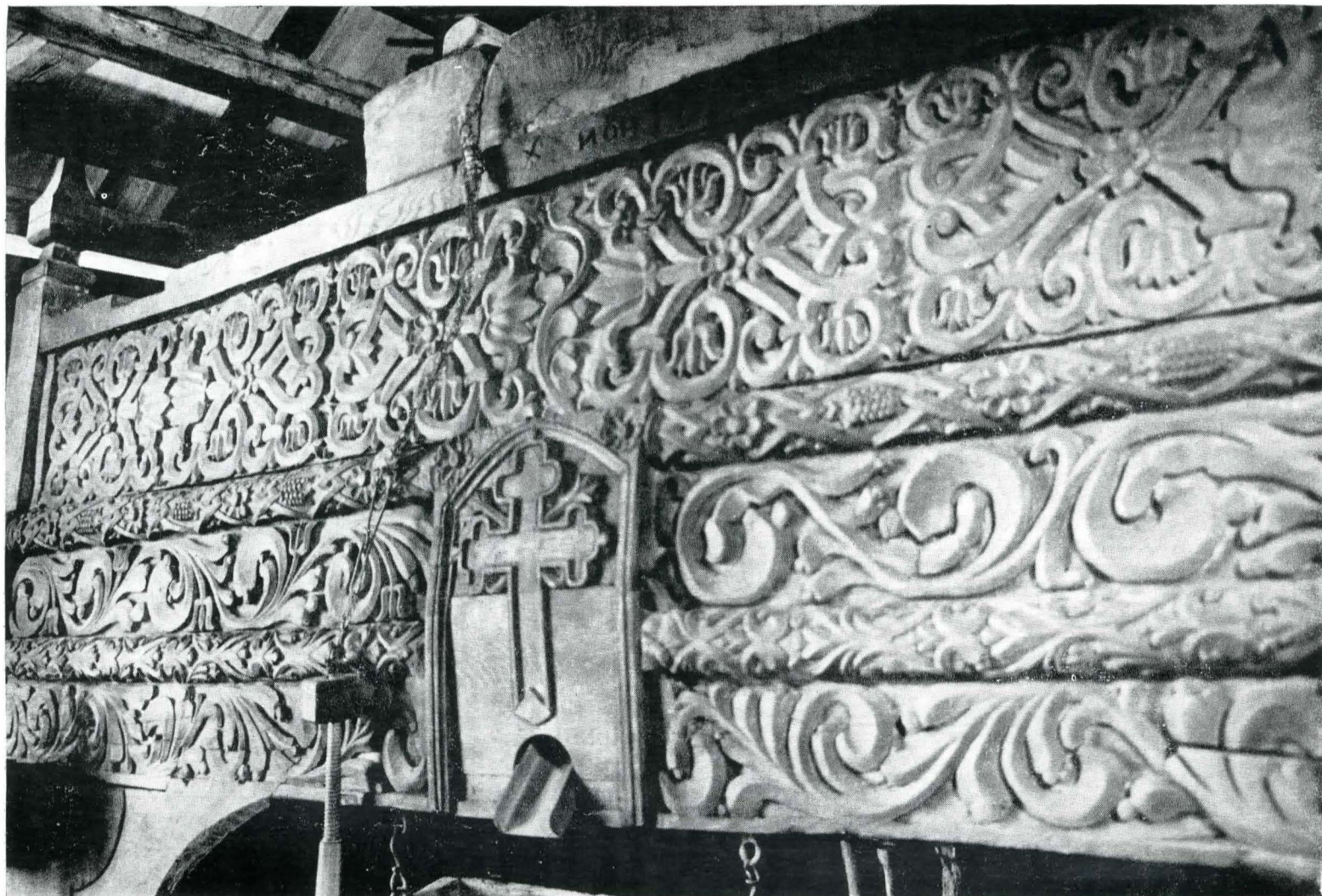
Fig. 8. Fruntarul morii din Josenii Birgăului, județul Bistrița-Năsăud (detaliu de interior). Moara este transferată în Muzeul etnografic al Transilvaniei, Cluj.

tradiției, acest element străin trebuie îndepărtat, eventual înlocuit cu elemente valoroase, provenind din aceeași așezare și, pe cât posibil, din aceeași vreme cu elementele componente principale ale ansamblului păstrat pe loc.