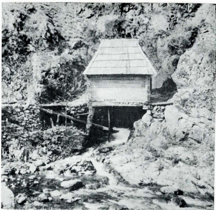
Fig. 6. Moară cu ciutură de pe valea Rudăria, comuna Rudăria-Bozovici, județul Caraș-Severin.

complexe din nordul Moldovei, de la Horezu sau Făgăraș. Jnele puncte însă, de mai mare aglomerare, — ulițe, părți de sate sau sate întregi —, care așteaptă să fie supuse conservării pe loc, amenajărilor diverse și integrării în viitoarele așezări, comportă un efort demn de prestigiul și capacitatea de intervenție a acestei Direcții. Cum situația reclamă îmbrățișarea lucrării la scară națională și cu răspunderea viitorului, D.M.I. s-ar afla în fața unui obiectiv de mare importanță și de adînci semnificații.