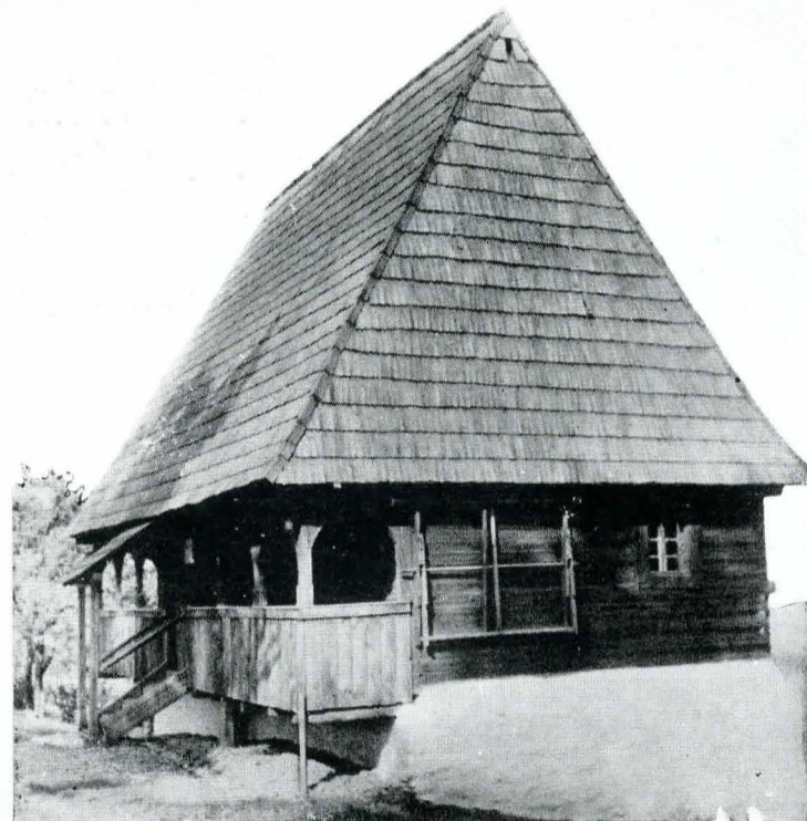
Fig. 2. Casă din satul Vidra, comuna Avram Iancu, județul Alba, transferată în secția în aer liber a Muzeului etnografic al Transilvaniei, Cluj.

Fără a minimaliza cituși de puțin amploarea, importanța, dificultățile, nivelul științific al principalelor lucrări de restaurare executate de D.M.I. între 1959–1969 și a celor care vor fi executate în viitor, sintem datori să insistăm pentru intervenții mai susținute din partea D.M.I., pentru conservarea, restaurarea și folosirea monumentelor de arhitectură populară, înțelegându-le în conținutul și rosturile lor reale. Și aceasta, pentru că, deși ne-am bucurat de tot sprijinul statului, bilanțul de pînă acum al eforturilor instituțiilor în sarcina cărora au stat studierea, evidența, îndrumarea, controlul, paza, protejarea, consolidarea, restaurarea și folosirea monumentelor de cultură 17 , în special ale construcțiilor — monumente țărănești, rămîne, așa cum afirma (referitor la situația mai veche) acad. prof. univ.