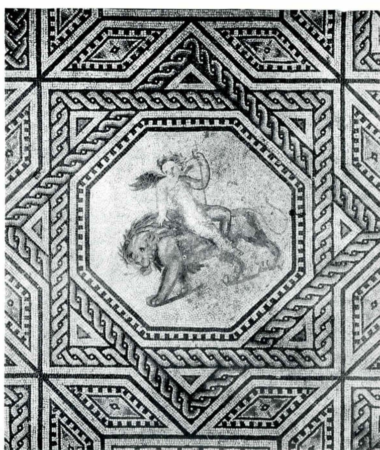
Fig. 8. Zeul iubirii călărind un leu.

În jurul imaginii centrale sînt grupate alte compoziții. În stînga panterei este redată în mod idilic o familie de satiri (fig. 6). Mama cîntă la un flaut frigian dublu, elimos, în timp ce tatăl șade pe un coș răsturnat, ținînd în