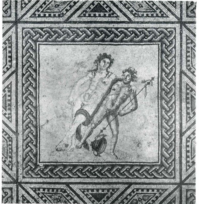
Fig. 5. Medalion reprezentîndu-l pe Dionysos.