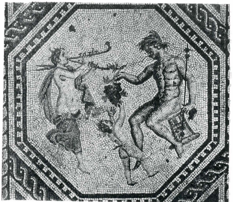
Fig. 6. Familie de satiri.