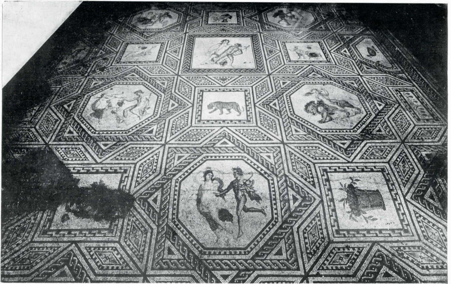
Fig. 1. Vedere generală asupra mozaicului.