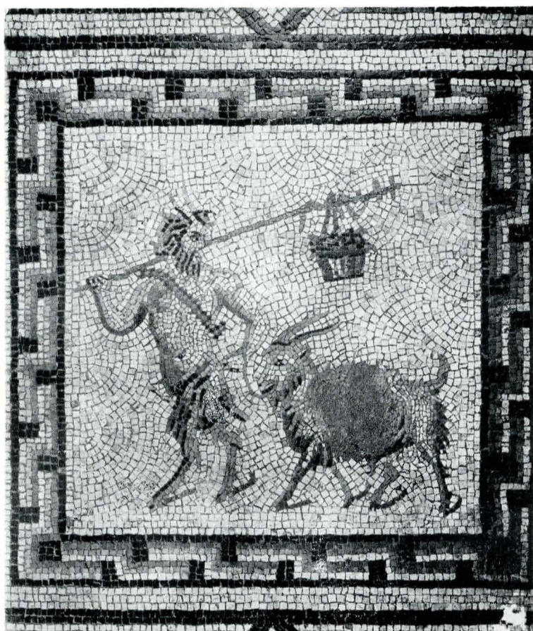
Fig. 7. Zeul Pan trăgând un țap.

În colaborare cu Istituto del Restauro din Roma și sub conducerea restauratorului Stefano Locati, în anul 1958 au fost folosite următoarele procedee de salvare a mozaicului 5 : deasupra mozaicului a fost lipită o pânză de iută în 2 straturi și acesta a fost înfășurat încet, ca un covor, pe rolă de lemn, scoțându-l astfel concomitent din lăcașul (patul) său antic. Cu aversul (fața) în jos a fost din nou derulat și curățat de resturile de mortar antic (fig. 4). În continuare a fost din nou turnat mortar și adus în forma unei plăci compacte. Concomitent s-a scos pământul și patul de mortar antic în care se afla inițial mozaicul, și în locul lor s-au montat stâlpi pe care a fost fixată placa masivă. Actualmente mozaicul este ferit de eroziune și umiditate printr-o constantă aerisire de jos în sus.