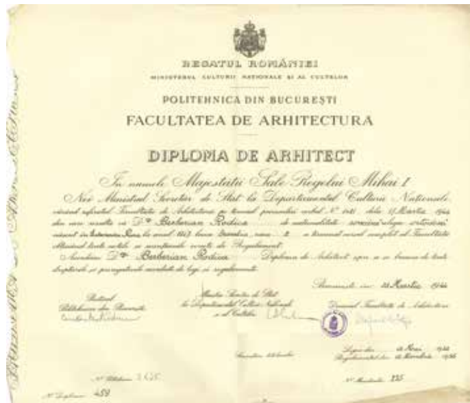
Fig. 7 Diploma de arhitect, martie 1944