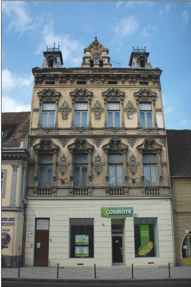
Fig.11. Mureșenilor 17. Fosta casă Nicolae Garoiu, stil eclectic, caracteristic pentru arhitectul Christian Kertsch.

frumoase fațade din oraș, creată sub influența rococoului vienez.