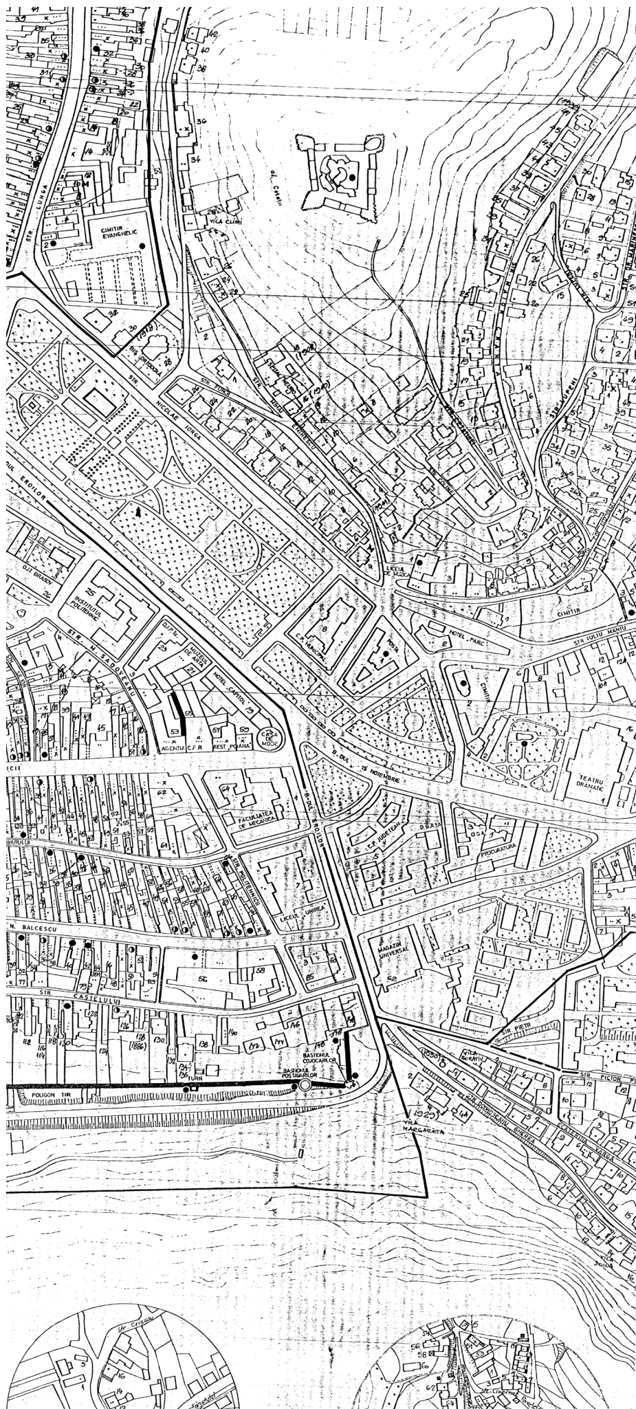
Planul Braşovului. Cetate