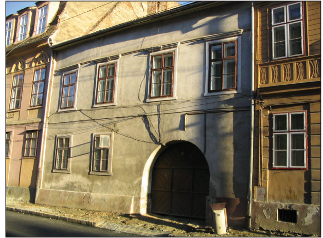
Fig.2. Poarta Schei 21. Cornișe cu scuturi similare celor din str. J. Gött 3, datate 1654.