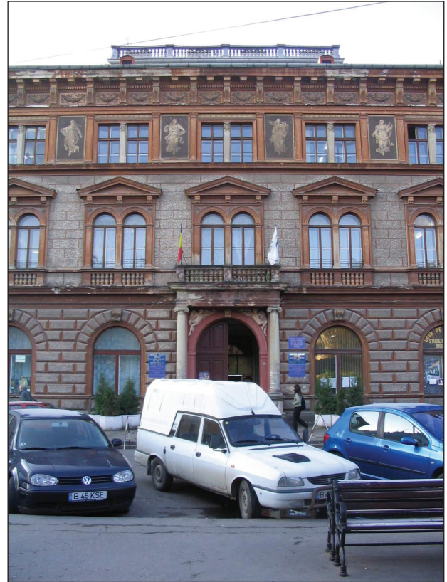
Fig.10. Eroilor 29. Fostul Pensionsanstalt, arhitect Peter Bartsch.

fiind considerată ca înrudită îndeaproape cu biserici reprezentative pentru acest stil: biserica Sf. Mihail din Cluj, biserica Sf. Nicolae “Din Deal” din Sighișoara, biserica evanghelică din Sebeș Alba, cu aceasta din urmă având în comun tipul de biserică-hală și structura corului cu deambulatoriu. Biserica Neagră este considerată a fi cea mai mare biserică în stil gotic târziu aflată la est de Viena .