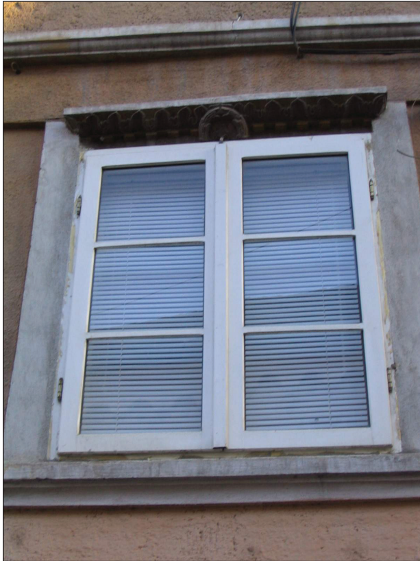
Fig.5. Poarta Schei 37. Ancadrament de gresie, tipic pentru ¼ sec. XVIII.

Din latura nordică a fortificației se păstrează o parte din curtile și turnurile incintei interioare, curtile incintei exterioare pe aproape întreaga lungime și bastionul de pe Graft. Un fragment din șanțul dintre cele două curtile se păstrează în curtea din strada Mureșenilor nr. 9. Drumul de-a lungul fortificației a dispărut începând cu sfârșitul sec. XVIII (1782), când locuitorii din străzile Mureșenilor și George Barițiu cereau permisiunea să-și extindă parcelele în zwingerele adiacente. La sfârșitul sec. XIX o parte a Zvingerului Curelarilor a fost vândută comunității catolice, acolo fiind construită, la 1900, școala confesională catolică. Bastionul Curelarilor a fost vândut și demolat în 1887.