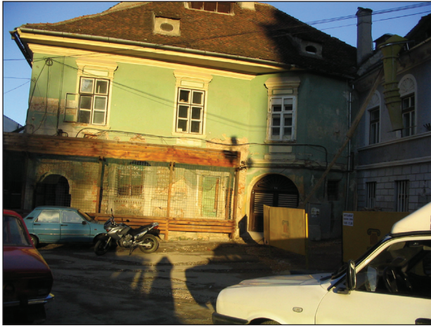
Fig.1. Piața Sfatului 16. Ancadrament cu baghete tipic pentru sec. XVI.

mișcărilor reformatoare religioase europene, în 1542, în Biserica parohială din Cetate, a avut loc prima liturghie în limba germană. În 1543, Reforma a fost oficializată de magistratul orașului, în următorii ani fiind adoptată de toți sașii din Transilvania. Prin desființarea mănăstirilor și simplificarea vieții eclesiastice Reforma a modificat imaginea orașului: în incinta mănăstirii Sf. Ecaterina fusese amenajat, încă în 1541, gimnaziul, capela Sf. Ecaterina a fost demolată în 1559 în locul său fiind construită „Școala mică”, curtea Capitlului a fost parcelată la 1560 și construită, capela Sf. Laurențiu, aflată între Biserică și Piață a devenit loc al cântarului public, mănăstirea Sf. Ioan a devenit depozit de grâne pentru circa 100 ani.