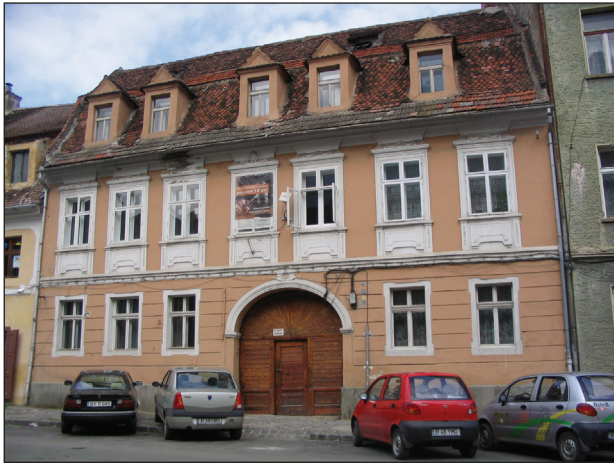
Fig.7. Nicolae Bălcescu 5. Fațadă cu decorație similară clădirii orfelinatului săsesc, datat 1806.