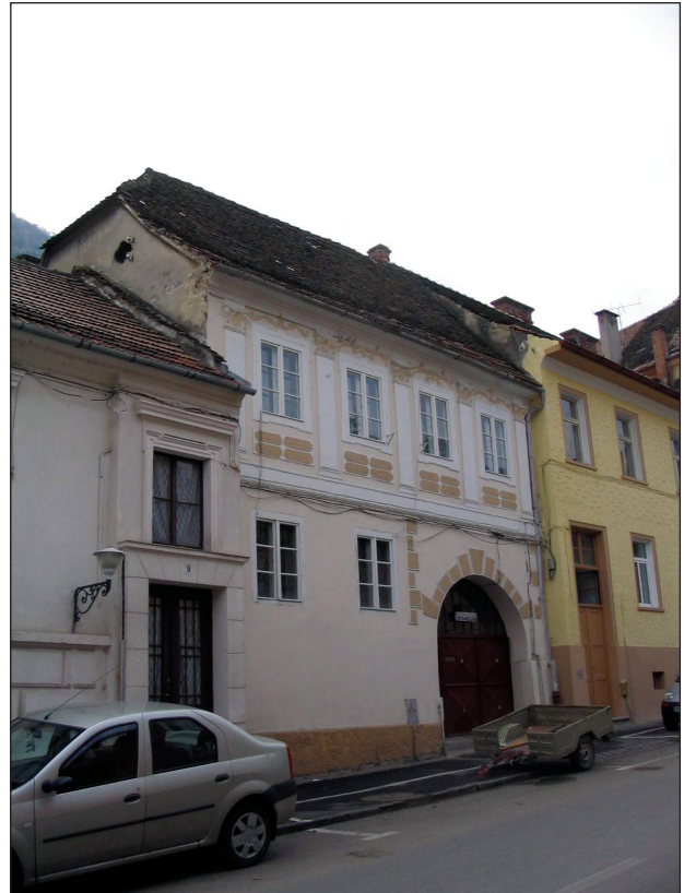
Fig.6. Castelului 6. La nivelul doi, elemente decorative de influență rococo.

Latura estică a fortificației avea traseu în sector de cerc și era, datorită poziției mai expuse, cea care posedea sistemul de fortificare cel mai complex. Pe această latură au fost construite, între 1639-1642, cele mai târzii componente ale fortificației. În extremitatea nordică se afla Bastionul, deja menționat, al Curelarilor, în extremitatea sudică se aflau Bastionul circular al Pânzarilor, dublat de Bastionul în formă de potcoavă al Tăbăcarilor, la mijlocul distanței între acestea se afla Bastionul poligonal al Aurarilor, construit între 1639-1642. La extremitățile estice ale străzilor Republicii și Mureșenilor se aflau două din cele trei porți al fortificației