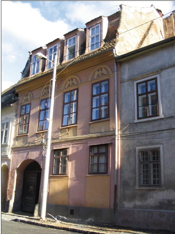
Fig.9. Poarta Schei 19. Fațadă în „stilul arcelor rotunde” (Rundbogenstil) și lucarne contemporane.