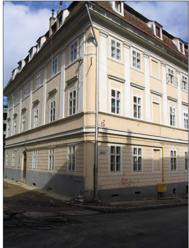
Fig.8. Poarta Schei 26. Fațadă în stil clasicist (1827, meșter constructor Dieners).

zeistic, în acest scop fiindu-i adăugat un acoperiș.