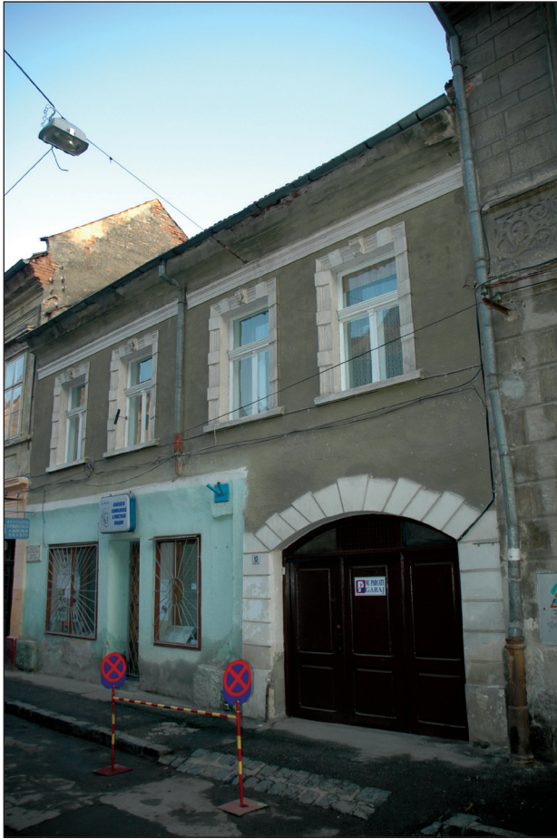
Fig.3. Postăvarului 10. Parterul a fost consolidat în 1694, după incendiul din 1689.

de la 1689 aproape dispăruseră, renașterea orașului în această perioadă fiind favorizată de renașterea meșteșugurilor și comerțului datorată unei perioade de liniște din punct de vedere politic. În 1778 a avut loc prima numărătoare a clădirilor, la acea dată în Cetate fiind înregistrate 615 numere.