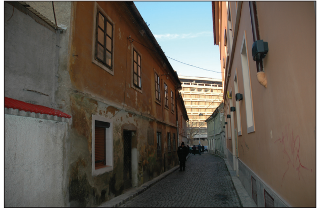
Fig.4. Valentin Wagner 1. Locuință cu bucatărie la nivelul solului și pivniță supraînălțată de încăpere de locuit.

(aceasta înlocuia mănăstirea dominicană și clădirile aparținătoare); construcția acesteia, ca și reconstrucția mănăstirii Sf. Ioan (1718) au fost legate însă de încercarea de recatolicizare a sașilor de la sfârșitul sec. XVII-a doua jumătate a sec. XVIII.