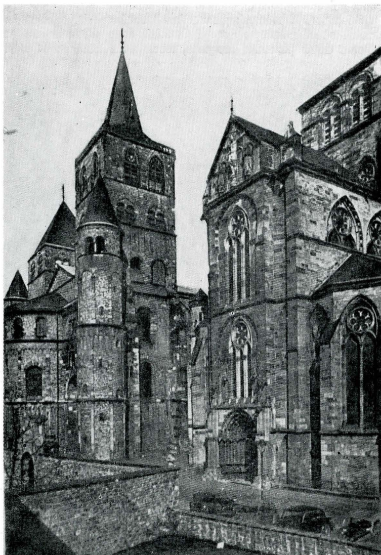
Latura sud-vestică a Domului din Trier stă alături de Libfrauenkirche, cea mai veche biserică gotică de influență franceză din R. F. Germania .

La adăpostul turnurilor cetății s-au ridicat numeroase monumente care fac posibilă reconstituirea destul de exactă a trecutului istoric și artistic al cetății.