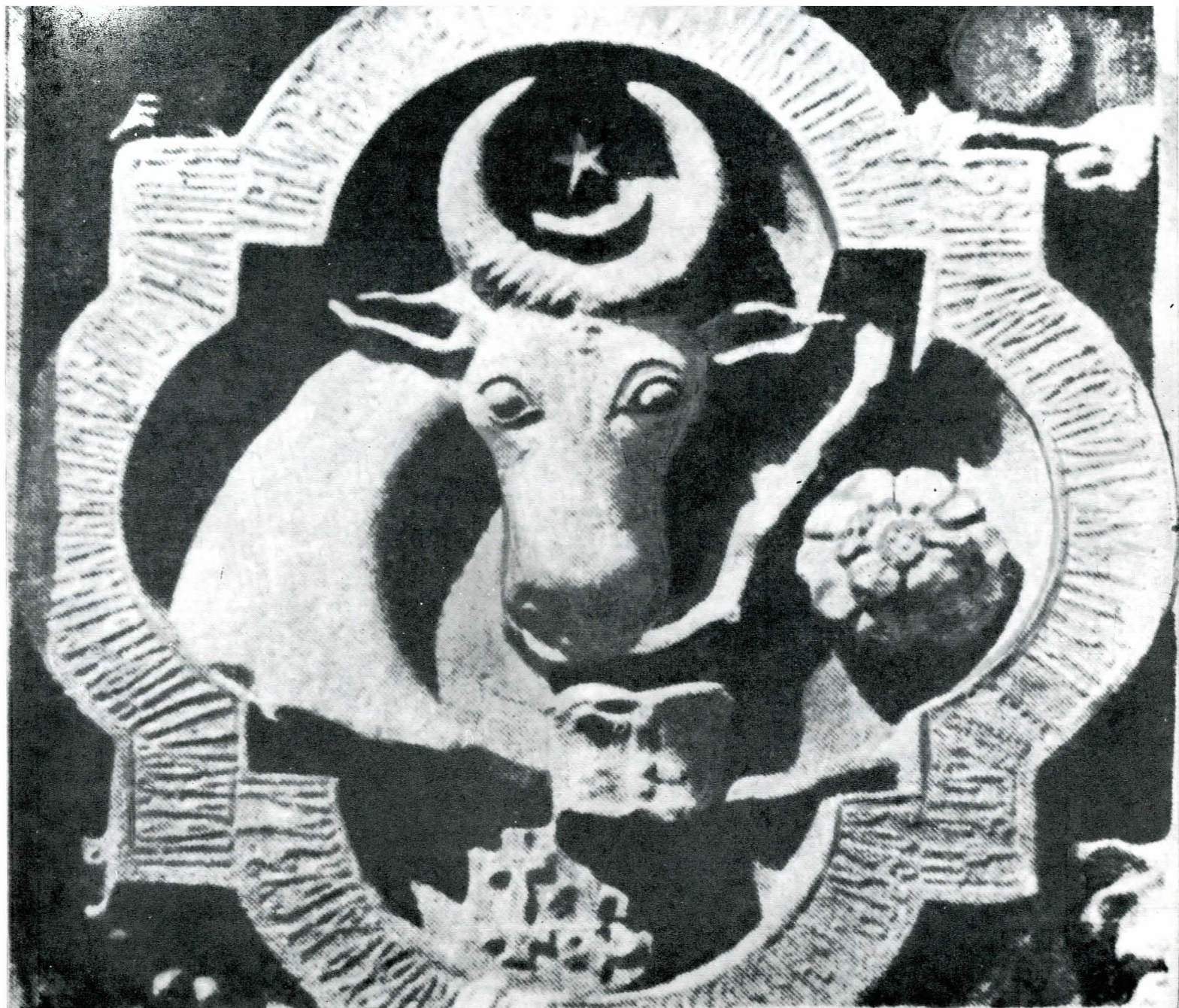
Fig. 4. Stema cu inscripția din 1481 de la mănăstirea Putna.

înaintea încăperii R. 6 3 . De altminteri, așa cum s-a stabilit ulterior, aici exista podul suspendat peste șanțul de apărare care făcea legătura între platoul din apropiere și cetate. Nu departe de locul unde au fost descoperite inscripțiile s-au găsit și pilonii de zid masiv (unul dintre ei având dimensiunile: 1,95X3,05 m de secțiune romboidală) ce susțineau podul de care am vorbit 4 .