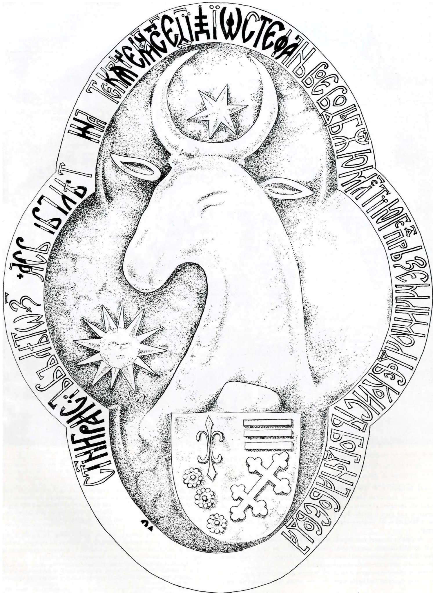
Fig. 3. Stema cu inscripția de la Cetatea Sucevei (desen de arh. A. Pănoiu)