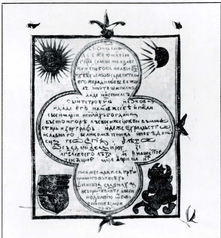
Fig. 2. Elemente heraldice din epilogul Evangheliarului de la 1502 aflat la Viena.

Deși nu această inscripție ne interesează direct în studiul nostru, am pomenit-o deoarece constituie un argument de bază în stabilirea amplasamentului pisaniiilor. Ele își aveau locul în primul rînd la intrarea principală în cetate, intrare care la acea vreme se situa între cele două rîndele