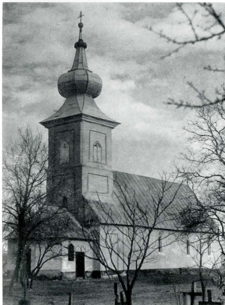
Fig. 1. Biserica mănăstirii din Remeși.