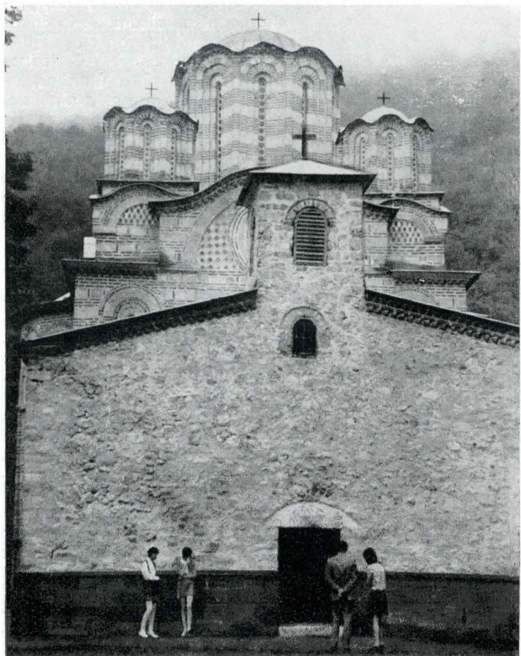
Fig. 2. Mănăstirea Ravanica, fațada de vest.

nară a bisericii, se află o friză de arcaturi, a cărei prezență aici este de pus pe seama influenței litoralului adriatic. Remarcabile sînt ferestrele bifore plasate pe două nivele la naos și altar.