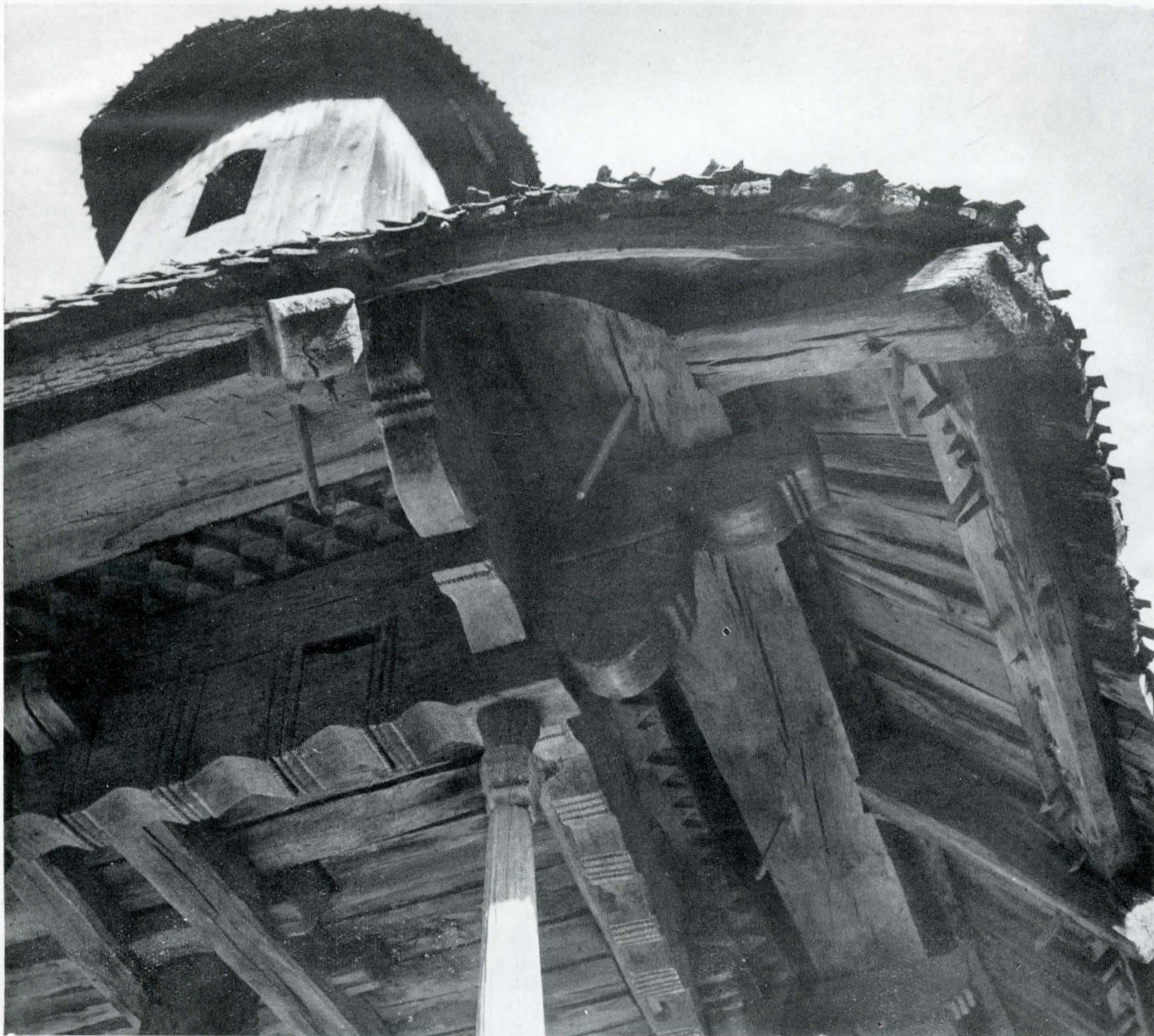
Fig. 3. Detaliu de îmbinări din pridvor.

Plastica arhitecturală, rezultată din ansamblul pridvorului, din ansamblul îmbinărilor, din efectul de umbră și lumină al unei streășini largi, sau a stîlpilor angajați, precum și broderia de creștături a colonetelor, fac din această biserică unul din monumentele care întruchipează, poate cel mai bine, îmbinarea procedeelelor logicii constructive cu principiul unui decorativism anume căutat, specific artei populare. Cele două rînduri de zimți, creștați în rama de grinzi ce infundă streășina, încearcă, în mod evident, să reproducă cornișele de cărămidă ale bisericilor din zidărie. La fel am putea, poate, să considerăm creștăturile de pe rama fruntarelor pridvorului, care amintesc ceva din „rosturile” lăsate de bolțarii de piatră ai unui lintou.