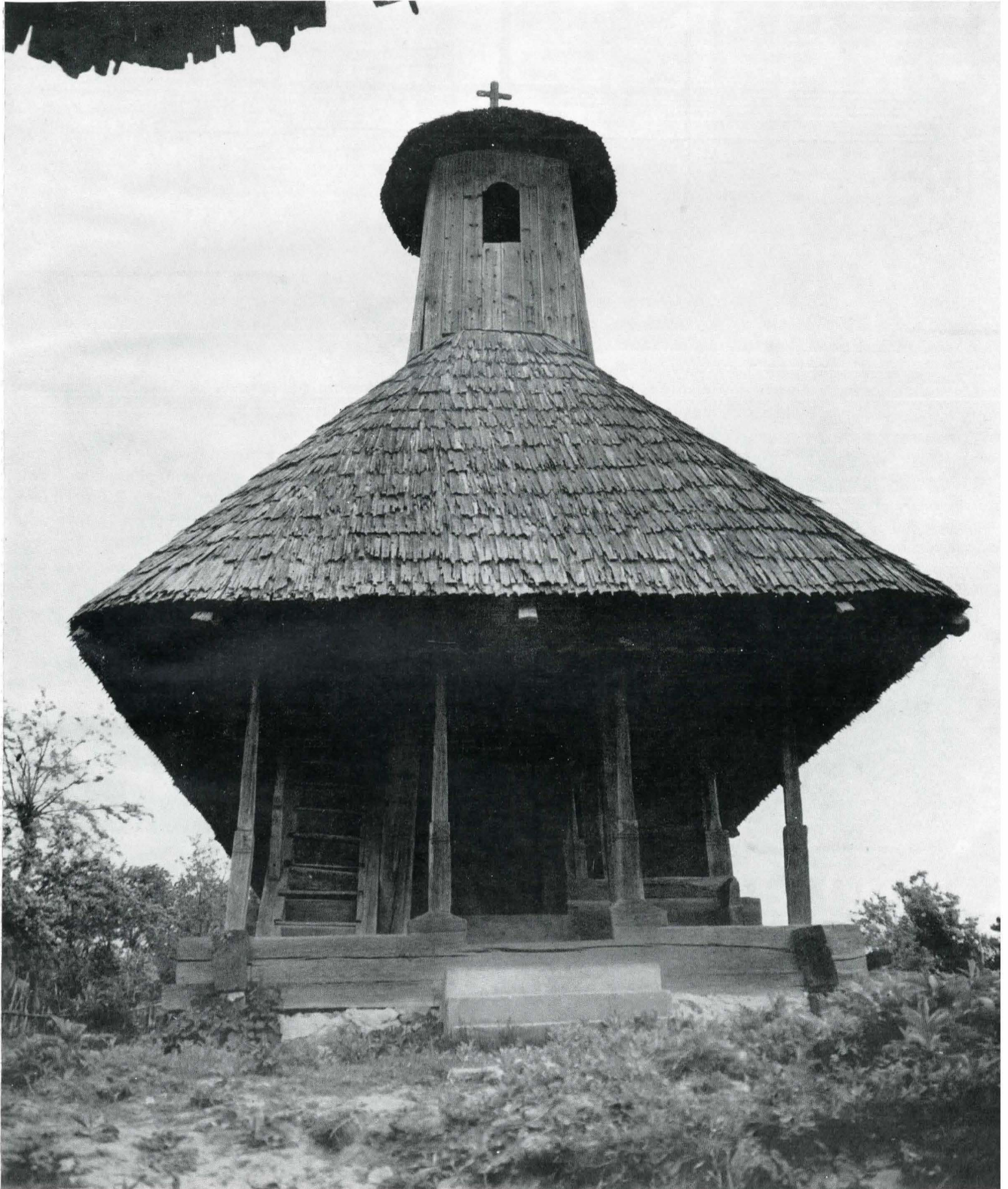
Fig. 1. Biserica din Pișteștii din Deal, vedere din fa