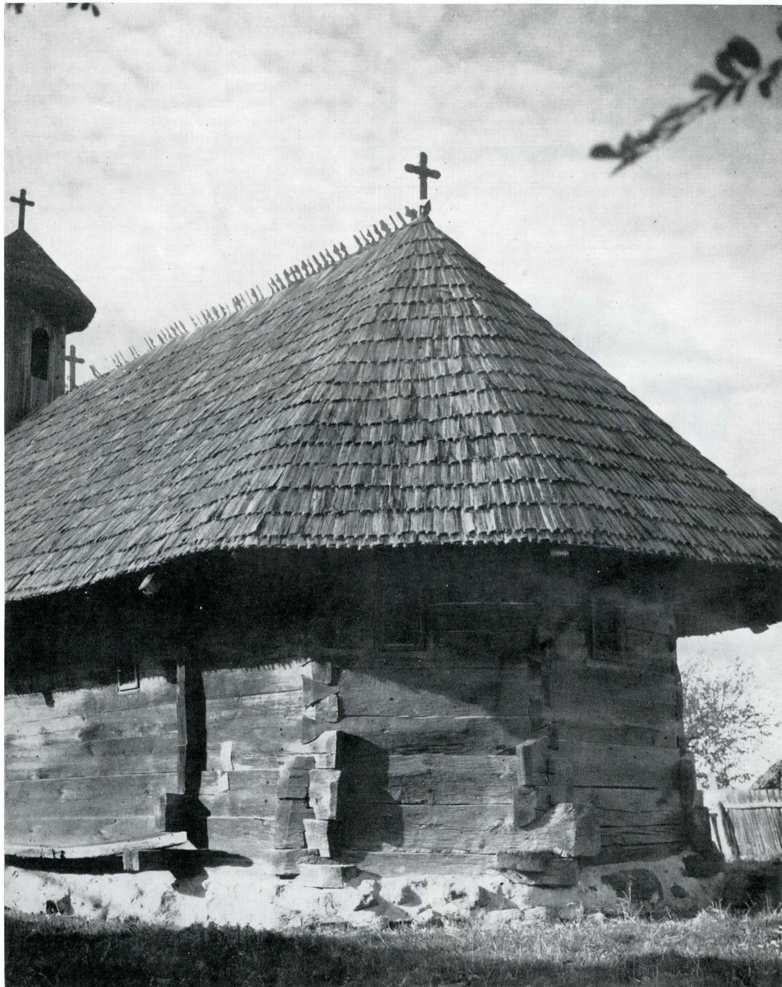
Fig. 4. Biserica din Pișteștii din deal, vedere din partea de sud-est.

renunțat niciodată de-a lungul întregului ev mediu românesc și în care se pot citi relațiile reciproce dintre diferitele programe ale arhitecturii noastre tradiționale.