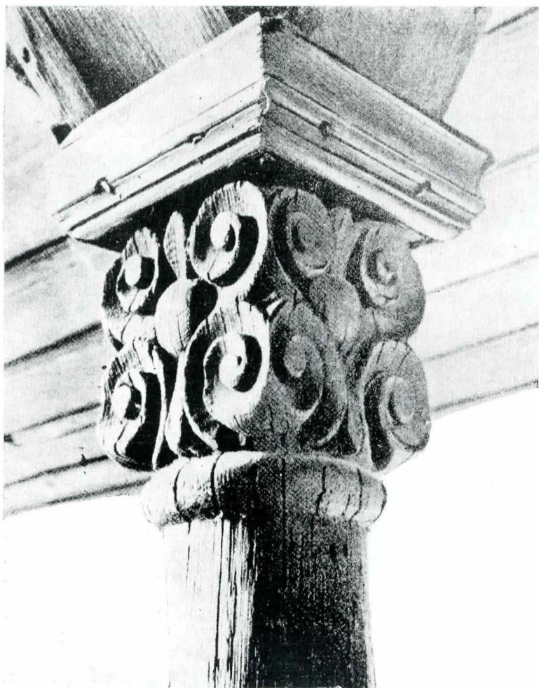
Fig. 1. Stilp de la foișor.

și în unele biserici 8 . Tavanul foișorului e construit din scinduri dispuse în „coadă de rândunică”.