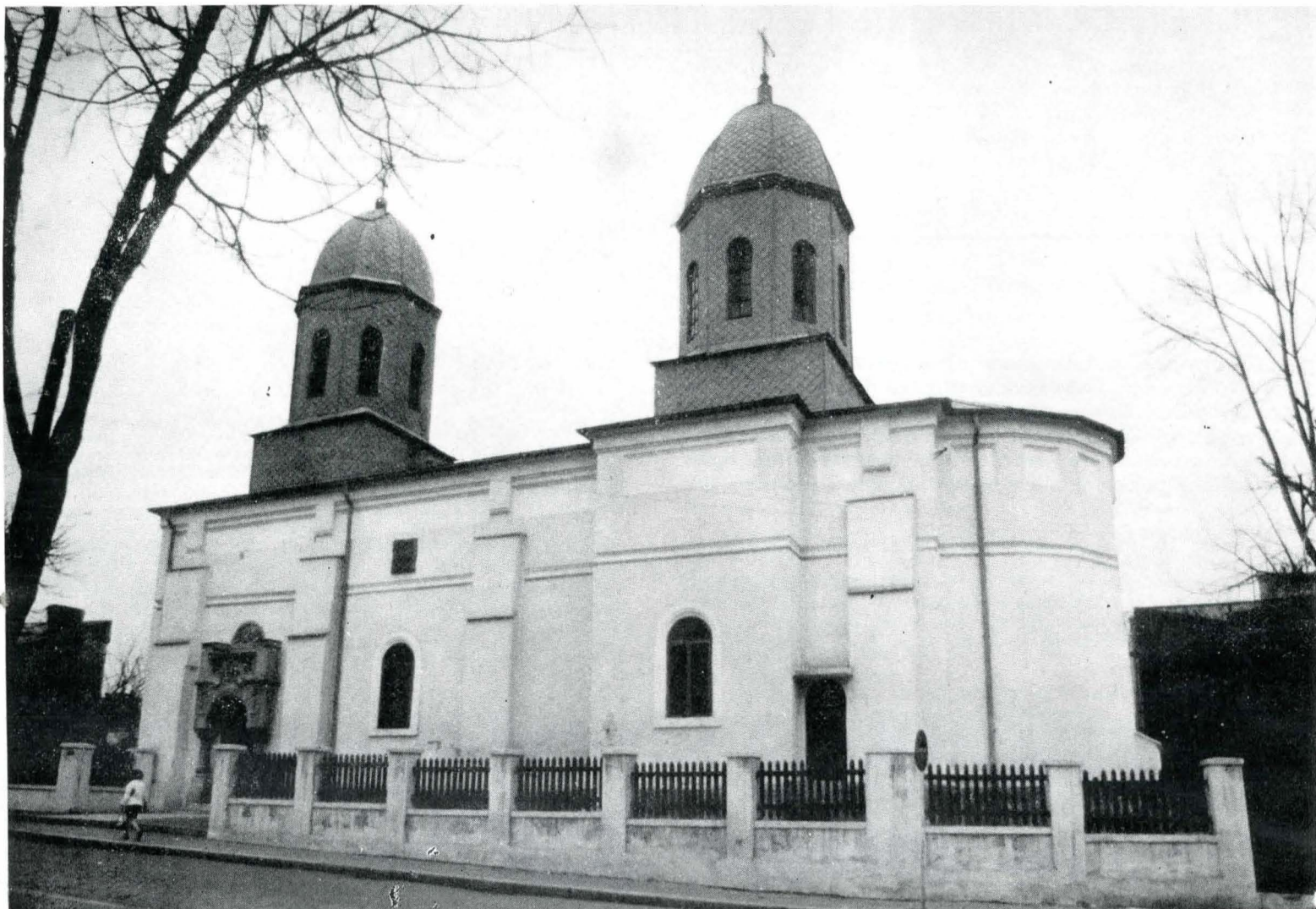
Fig. 2. Biserica Mavromol.

exista în 1685 3 , fiind reconstruită de Constantin Duca în 1700–1703. I. C. Beldie, N. Iorga și Constantin C. Giurescu 4 consideră că mănăstirea a fost zidită de Constantin Duca în cea de a doua domnie (14 septembrie 1700 – 15 iunie 1703). Mai exact, după precizarea letopisețului atribuit lui N. Costin, „in al doilea an” 5 , adică la sfârșitul lui 1702, cum propunea Alexandru Papadopol Calimah 6 .