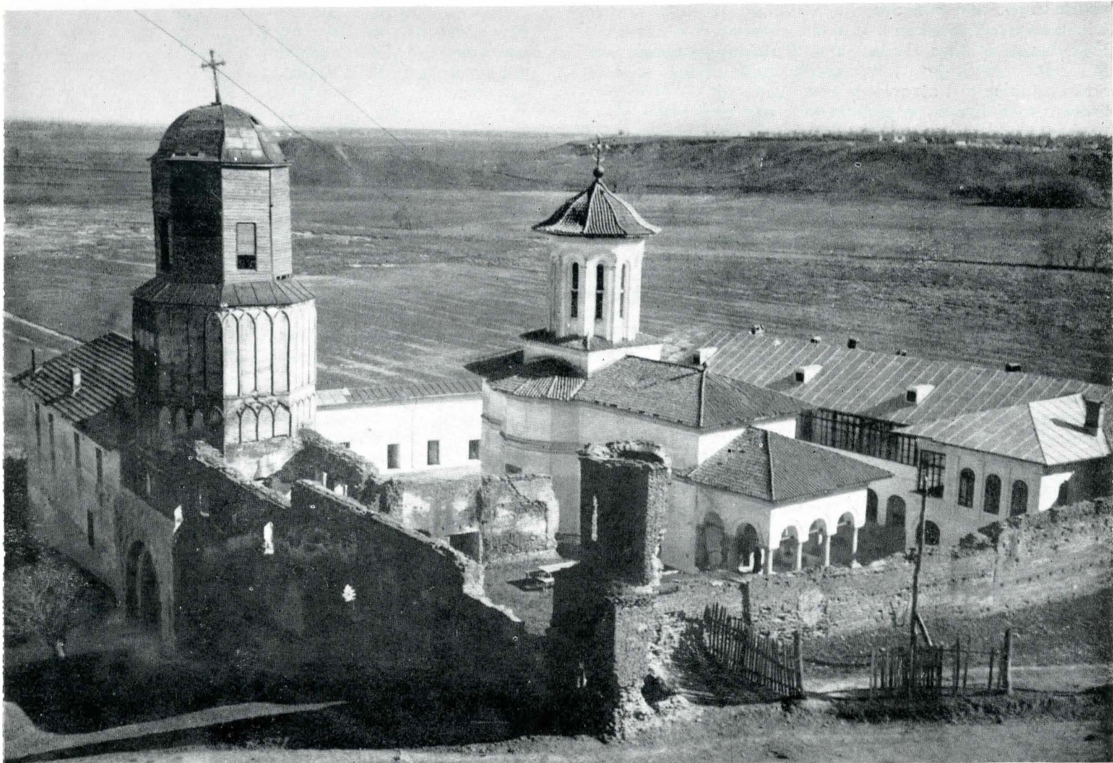
Fig. 2. Mănăstirea Brîncoveni văzută dinspre nord-vest. Situația din 1957.

O altă problemă o constituie terasa de pe latura de vest a curții interioare, legată de casele egumenești pe latura de sud a acestora. Terasa n-a existat de la început. Terenul era însă ușor înclinat și în parte pavat cu trepte de cărămidă. În locul curținei actuale de vest fusese alta, prăbușită probabil din cauza presiunii solului aluvionar dinspre coastă. Fisura de innădire a noii curține cu prelungirea ei dinspre casele egumenești se vede perfect (vezi fig. 14). Noua curtină a fost precedată spre curte de o bază solidă, din cărămidă, formînd o platformă de 80 cm lărgime, adîncă de 55 cm, la 65 cm sub solul actual, întinzîndu-se sub întreaga latură, purtînd și contraforturile care sprijină dinspre interior zidul. Calitatea acestei curține și forma contraforturilor, identică cu cea întilnită la reconstrucția aripii de sud a mănăstirii (brîncovenească, dar refăcută în secolul al XIX-lea), par a justifica datarea și întreaga organizare a terasei în secolul al XIX-lea. Inițial solul terasei fusese ceva mai jos și accesul se făcea la capătul de nord, tocmai lingă casele egumenești. Urmele scărilor și ale spațiului rezervat în parapetul actual ca intrare au și fost descoperite. Scările erau parte din cărămidă, parte din piatră (fragmente de o piatră de moară), așezate pe sol.