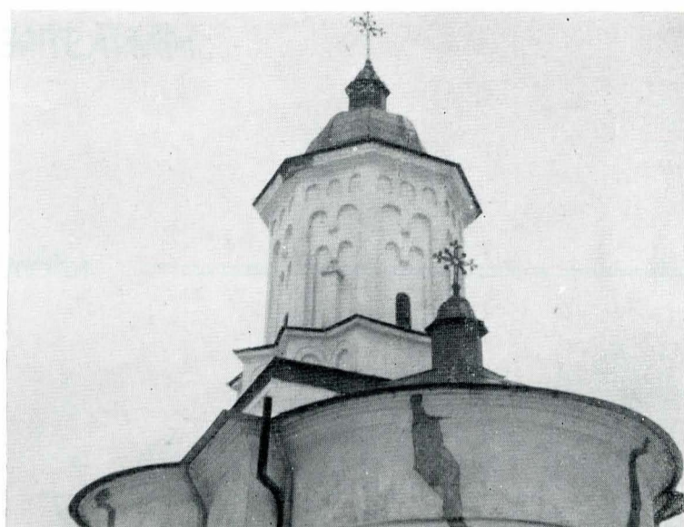
Fig. 3. Turla bisericii mănăstirii Hlincea, vedere spre sud-est

O mănăstire mică, din apropierea „Cetățuiei” de lângă Iași, a stîrnit, în jurul anului 1930, o întreagă dispută între specialiști, dispută care nu s-a încheiat atunci și care este aproape complet uitată astăzi.