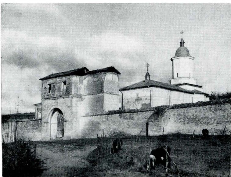
Fig. 2. Vedere generală asupra mănăstirii Hlincea.