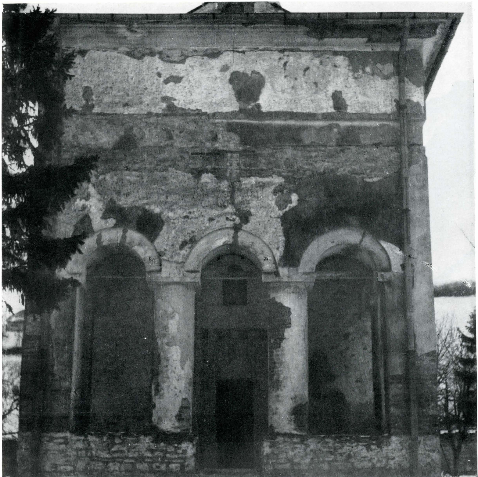
Fig. 4. Pridvorul, vedere spre vest.

mici nu au presupus un număr mai mare de ferestre 38 . Cele două, una la sud și una la nord sînt ușor lărgite spre interior, mai ales la bază, față de dimensiunile exterioare. El este boltit cu o simplă calotă semisferică sprijinită de două rînduri de arce foarte subțiri pe fiecare parte.