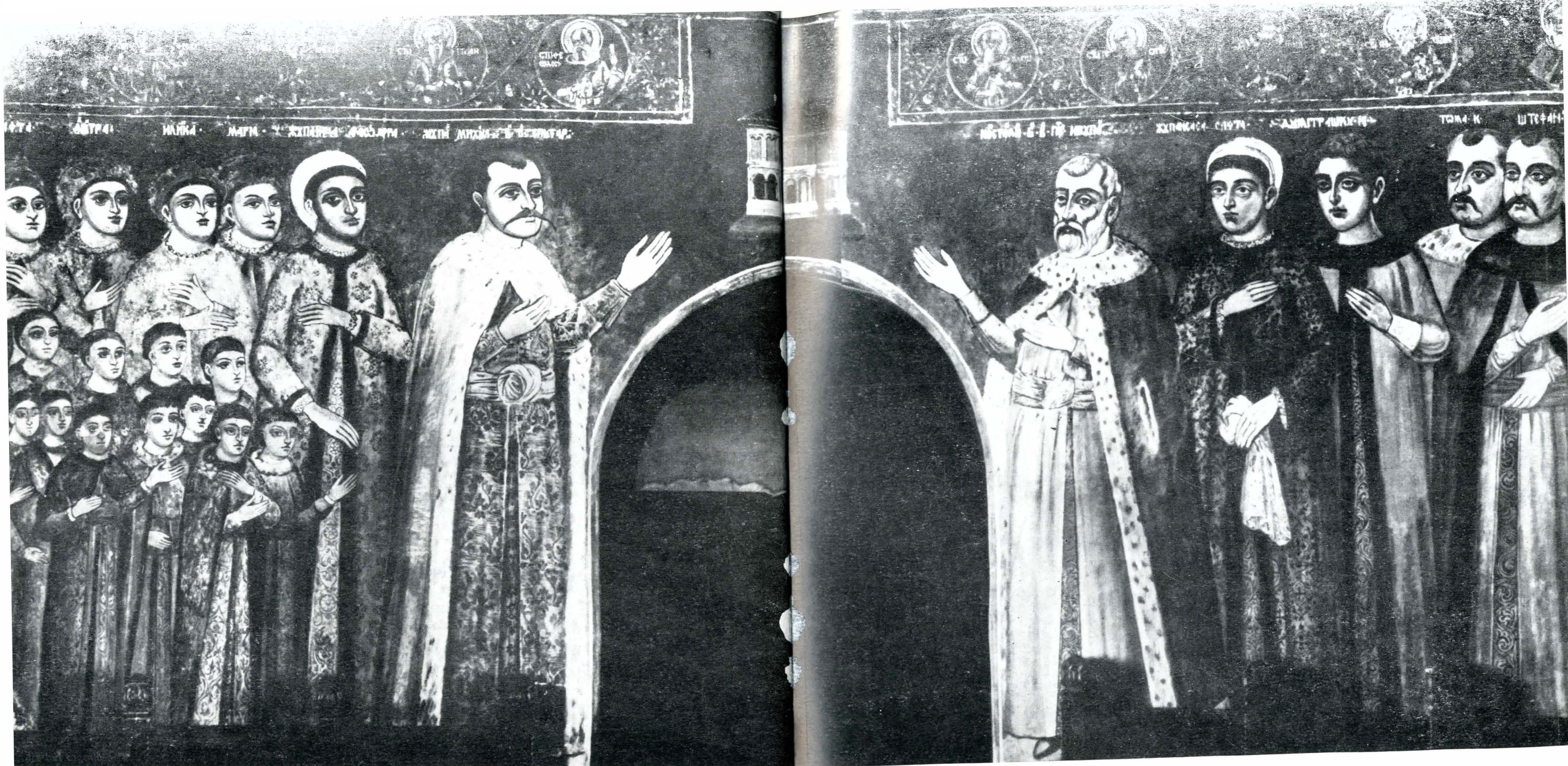
Fig. 2. Tabloul ctitorilor din pronaos (peretele vestic).

Că satul Stilpu era totuși proprietatea lui Mihai Cantacuzino este în afară de orice îndoială, faptul fiind confirmat de două mențiuni documentare precise: un zapis al unui meșter de biserici cu numele de Alexea Rusul, din 18 martie 1699, arătând cum s-a tocmit cu pircălabul satului pentru facerea unei biserici de lemn „dumnealui spătarului Mihai din Stilpu” 4 ; apoi un înscris din anul 1712 al contelui Michaelae Mikes de Zabola, împreună cu alți trei nobili ardeleni, care, căutându-l pe Mihai spătarul pentru o chestiune de schimb de proprietăți, arată că l-au găsit pe acesta, la 6 noiembrie 1710, „în satul său numit Stilpu” 5 .