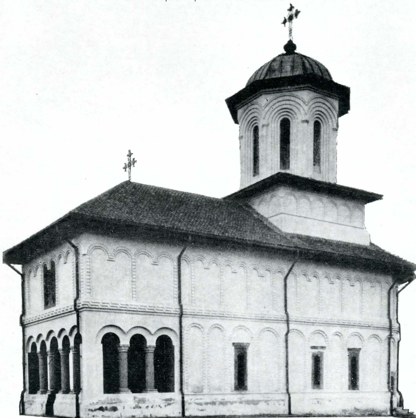
Fig. 1. Biserica din Stîlpu. Vedere dinspre sud-est.

Atît prin numărul cît, mai cu seamă, prin valoarea artistică a ctitoriilor sale, spătarul Mihai Cantacuzino ocupă incontestabil primul loc printre boierii care, alături de domnitor, au contribuit la remarcabila înflorire a artelor în Țara Românească din vremea lui Constantin Brîncoveanu.*