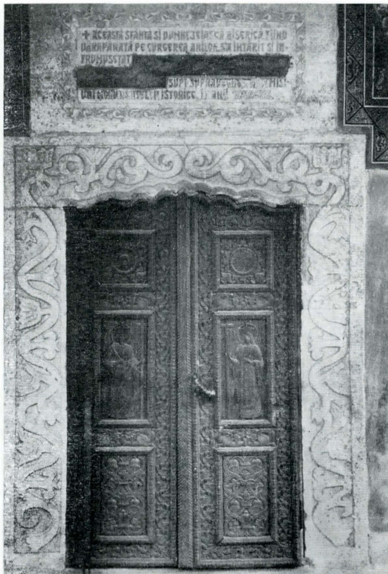
Fig. 5. Intrarea în pronaos cu ancadramentul original.