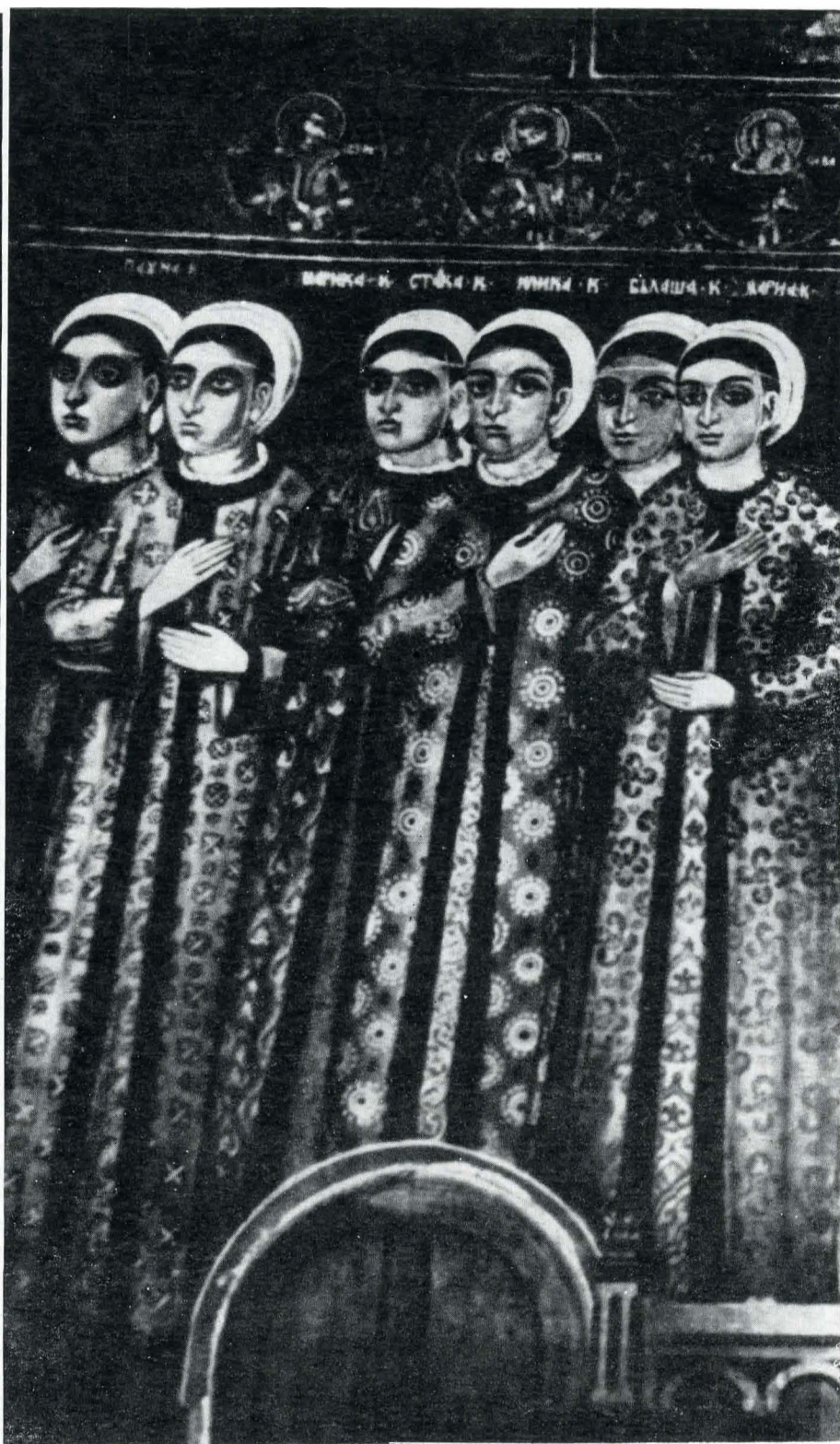
Fig. 4. Tabloul ctitorilor din pronaos (peretele nordic).

C(antacuzino)", „Ilinca C(antacuzino)", „Bălașa C(antacuzino)", „Maria C(antacuzino)", nume ce corespund cu acelea ale surorilor spătarului, fiicele marelui postelnic Constantin Cantacuzino, afară de Maria poate scris greșit în loc de Ancuța, care lipsește.