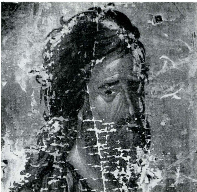
Fig. 6. Icoana din Domnești; Capul lui Ioan Botezătorul.

Ipoteza noastră ar putea eventual părea unor cercetători puțin întemeiată, îndrăzneată. Însă în sprijinul ei vine însuși spiritul epocii.