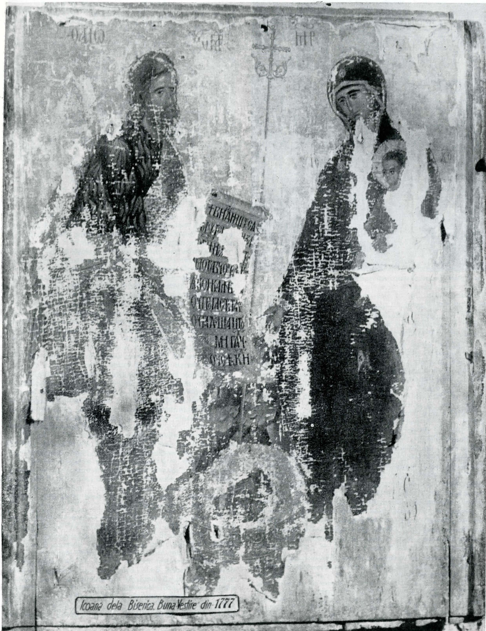
Fig. 1. Icoana Ioan Botezătorul și Maica Domnului cu Pruncul (sec. XVI), Domnești.