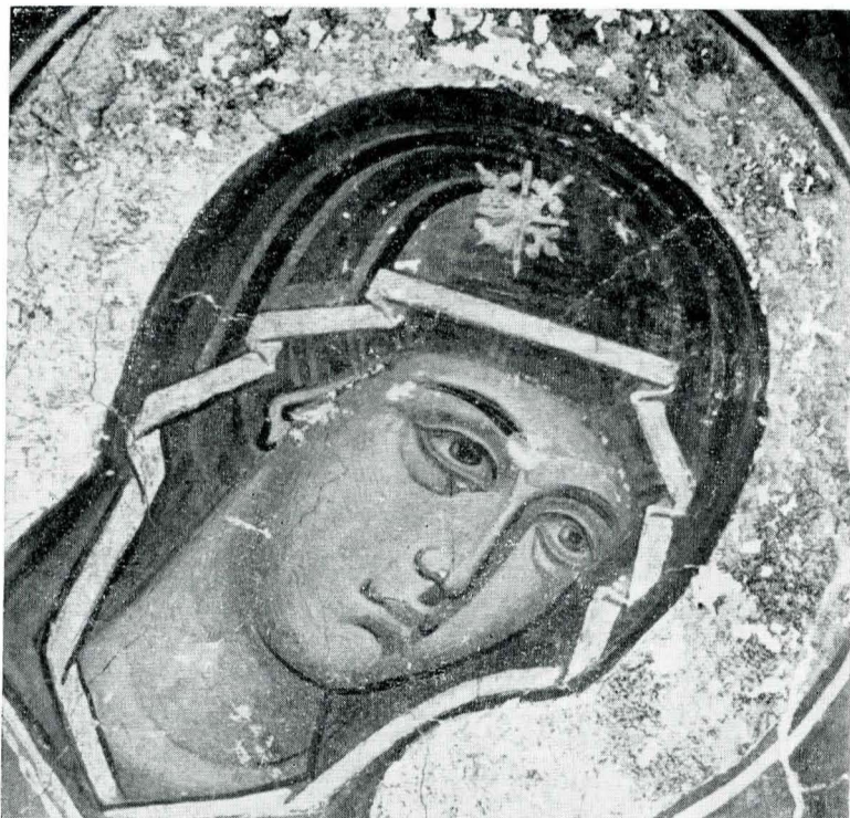
Fig. 3. Maica Domnului; Detaliu din pictura murală de la Curtea de Argeș (Muzeul de artă al R. S. România).