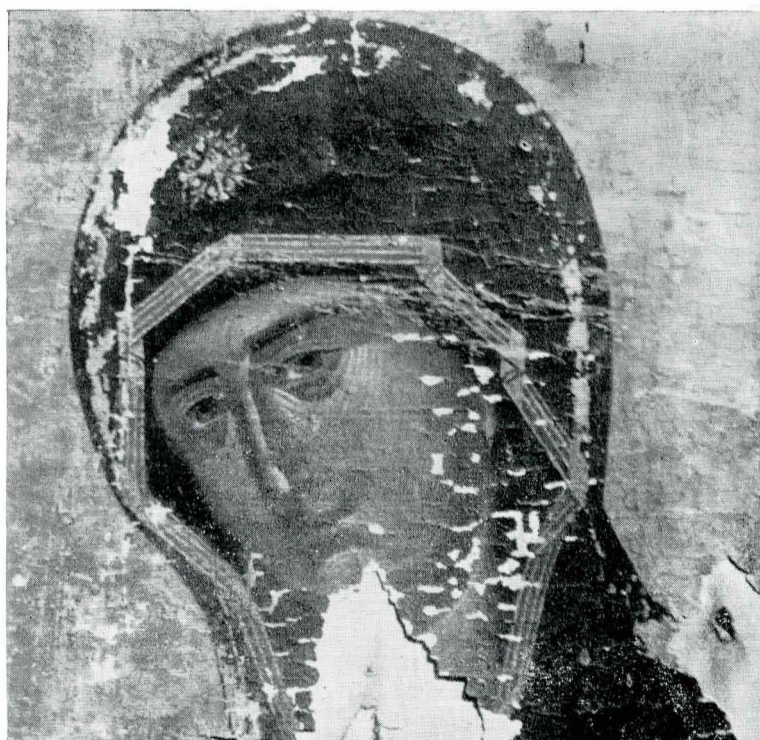
Fig. 4. Icoana din Domnești; Capul Moicii Domnului.

din Domnești, este contemporan cu artiștii care au executat aceste ansambluri și se poate plasa din punct de vedere al viziunii și calităților artistice pe un loc intermediar între pictura bisericii Episcopale de la Curtea de Argeș și cea a bolniței Bistriței 6 .