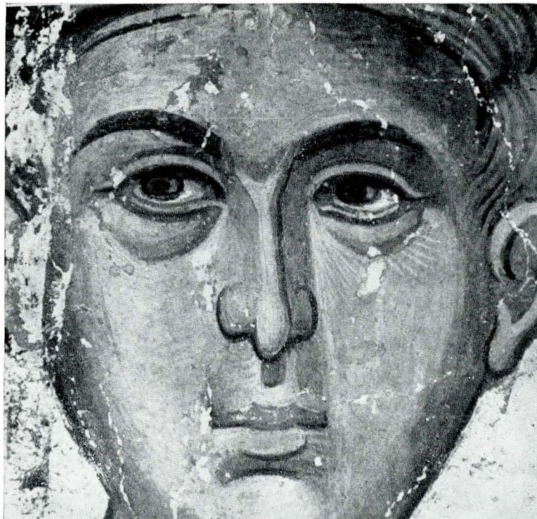
Fig. 5. Sf. Procopie ; Detaliu din pictura murală de la Curtea de Argeș (Muzeul de artă al R. S. România).

pînă la o confirmare sau infirmare documentară. După cum am văzut, pe baza analogiilor existente între icoana din Domnești și pictura „epocii lui Neagoe Basarab”, le putem considera lucrări „contemporane”: calitățile de stil și tehnică și prețiozitatea materialelor ne permit să credem că icoana a aparținut bisericii Episcopale de la Curtea de Argeș; semnificația simbolică a iconografiei ne îndreptățește s-o considerăm drept o aducere aminte și o rugă în același timp a celui (sau a celor) ce au comandat-o, pentru sufletul unui răposat Ioan. Documentele vremii, precum și reprezentări figurative contemporane ne fac cunoscut că unul din fiii lui Neagoe Basarab, mort copil, se numea Ioan. Mormîntul lui se află în dreapta pronaosului bisericii Episcopale de la Curtea de Argeș și poartă data de 27 noiembrie, fără a indica însă anul, care nu poate fi decît 7026 sau 7027 (1518 sau 1519) 16 . Astfel sînd lucrurile, este foarte probabil ca icoana de la Domnești să fi fost comandată în amintirea acestui tragic eveniment din familia domnitorului muntean 17 . Ea ar fi putut să-și găsească locul pe unul din pereții pronaosului în apropierea mormîntului lui Ioan și a surorii sale Anghelina, care l-a precedat în „lumea de apoi” cu aproximativ un an, deoarece, după cum este bine cunoscut, pictura murală a bisericii nu a fost terminată decît după moartea lui Neagoe și deci existau numeroase spații ce ofereau posibilitatea, – ba chiar o cereau – de a fi decorate 18 .