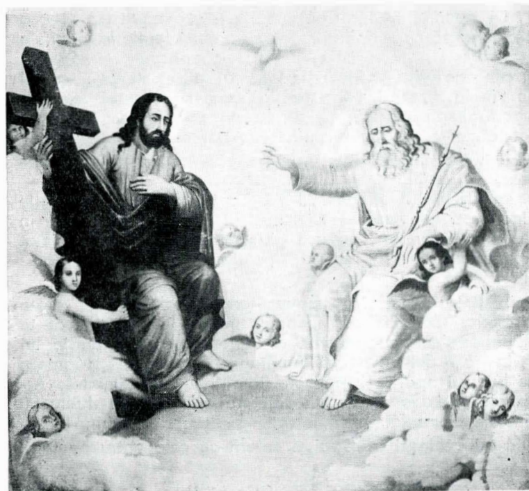
Fig 1. Constantin Lecca, Sfînta Treime.