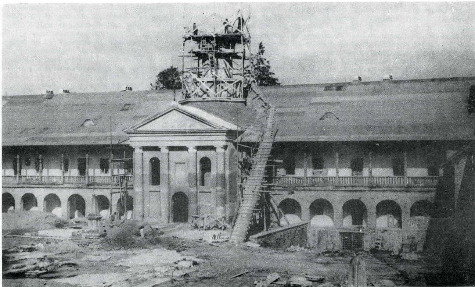
Fig. 5, 6. Biserica Sf. Gheorghe de la mănăstirea Neamț, în timpul și după restaurare.