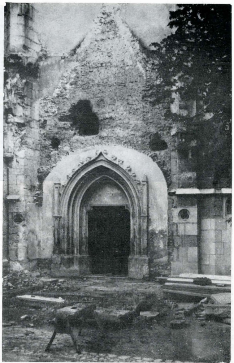
Fig. 4. Restaurarea bisericii din Sebeș, fațada de sud.

Continuând și dezvoltând tezele enunțate de Al. Odobescu și de Nicolae Iorga, Direcția monumentelor istorice și de artă este datoare să intensifice cercetarea monumentelor, cercetare de tip complex care trebuie să preceadă și să pregătească orice activitate de restaurare, care trebuie să însumeze rezultatele științifice ale restaurărilor, îmbogățind literatura de specialitate cu contribuții originale. Direcția monumentelor istorice și de artă trebuie să realizeze repertorii analitice ale patrimoniului, să încurajeze studiile monografice și zonale, să culegă inscripțiile, să cartografeze siturile arheologice și urbane, să asigure o largă circulație a