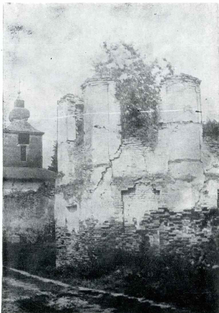
Fig. 1. Ruinele palatului egumenilor; turnul de sud-est.