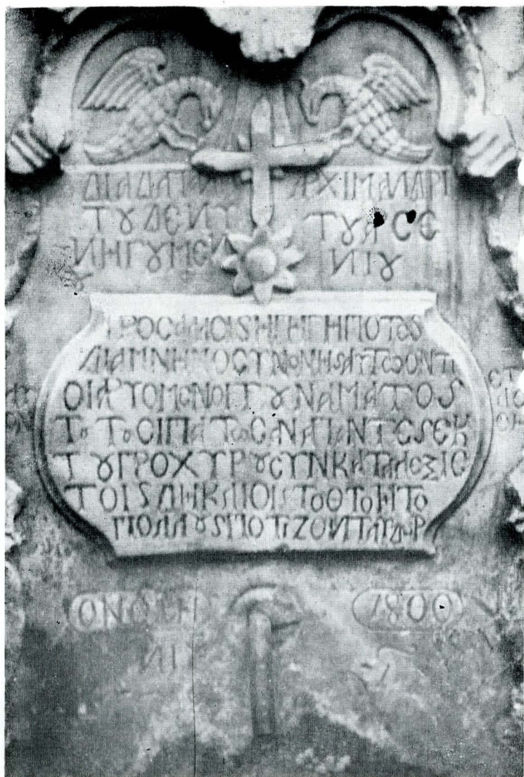
Fig. 4. Placa de marmură a cișmelei.

Din aceste fonduri, egumenii Mirei, ce se declaraseră, în 1835, degrevați de orice obligație culturală către locuitorii țării 50 , nu înțelegeau să cheltuiască nici măcar sumele necesare desăvârșirii unor construcții de pe moșiile mănăstirii, cum era de pildă biserica din Lespezi 51 . Dar odată cu urcarea în scaunul domnesc de la Iași a lui Grigore Al. Ghica (1849), controlul statului asupra mănăstirilor închinat crește, în sensul unei contribuții a acestora la dezvoltarea țării. Secundat de ministrul său de Culte și Instrucție Publică, Dimitrie Rallet, principele dovedea o stăruitoare preocupare pentru desăvârșirea și conservarea monumentelor românești. Ca atare, egumenul de la Mira, Anania Miron, se va supune ordinelor de la Iași pentru isprăvirea bisericii din Lespezi 52 . Se va fi început tot acum construirea bisericii din Adjudul Vechi, rămasă însă neterminată 53 .