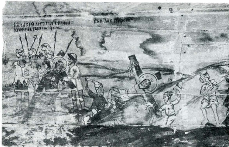
Fig. — 6 Scene din ciclul „Patimilor”.

În registrul superior, semicircular, al iconostasului (care încheie complet, pînă la arcul bolții, spațiul dintre naos și altar), printre ornamente pictate cu viață de vie și struguri, sînt distribuiți în medalioane proorocii: Moise, Iacob, Daniel,