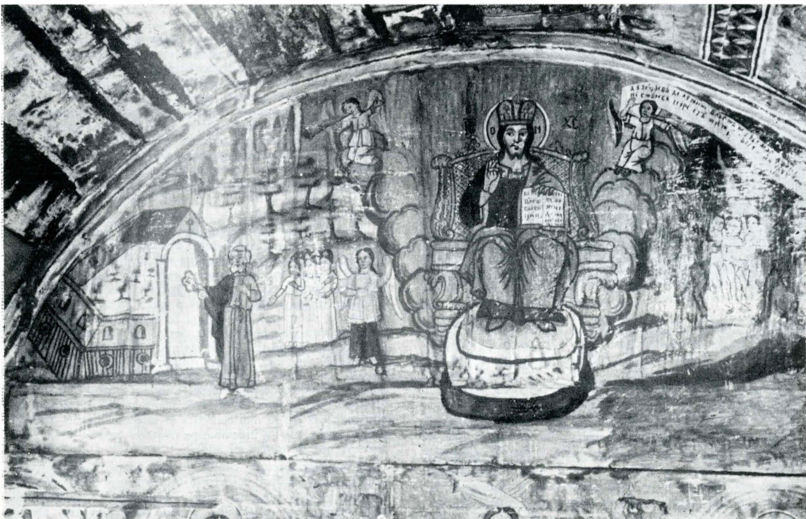
Fig. 1 — „Judecata de apoi”.