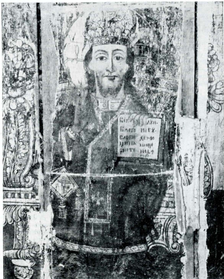
Fig. 7 — Icoană împărătească.