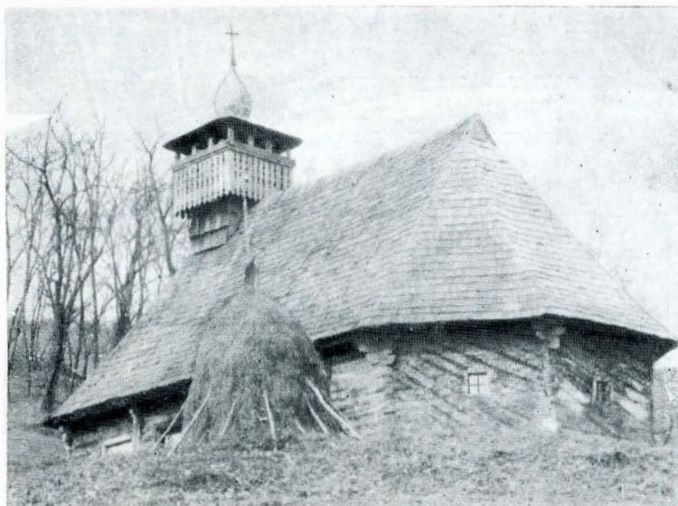
Fig. 4 — Biserica din Troaș.

acoperișul galeriei o leagă de tipul mai nou de pe Valea Mureșului, influențat de construcțiile baroce. De altfel, în cea de-a doua jumătate a secolului al XVIII-lea, pe teritoriul fostului comitat Arad apar numeroase realizări de arhitectură barocă, dintre care trebuie menționate biserica ortodoxă sîrbă din Arad, mănăstirea Sf. Simion Stîlpticul din Arad-Gai, castelul ducelui Schulcovschi de la Pîncota, iar străvechea biserică ortodoxă română din Lipova, în urma unor restaurări, primea înfățișarea barocă pe care o are și astăzi. Chiar în apropiere de Troaș, la Săvrîșin, se ridicase edificiul baroc al unei biserici catolice, azi distrusă. Pe de altă parte văile Troașului, Petrișului, Pîrneștilor, care se varsă în Mureș, au constituit totdeauna în trecut căi de pătrundere spre Țara Zarandului și dinspre această zonă spre Valea Mureșului, a unor forme de artă datorate românilor din aceste părți. În lumina considerațiilor