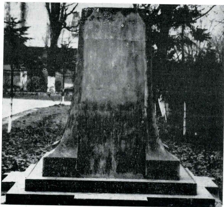
Fig. 5. Obelisc dedicat „Eroilor căzuți pe cîmpul de onoare 1877—1978”.

spre Piața Victoriei, un impunător monument din bronz, format din 3 luptători, purtînd pe o targă un camarad căzut în luptă. Operă a aruștilor Ion Jalea și Artur Verona, monumentul constituia un omagiu pe care corpul didactic îl aducea ofițerilor de rezervă, învățătorii și profesorii, morți