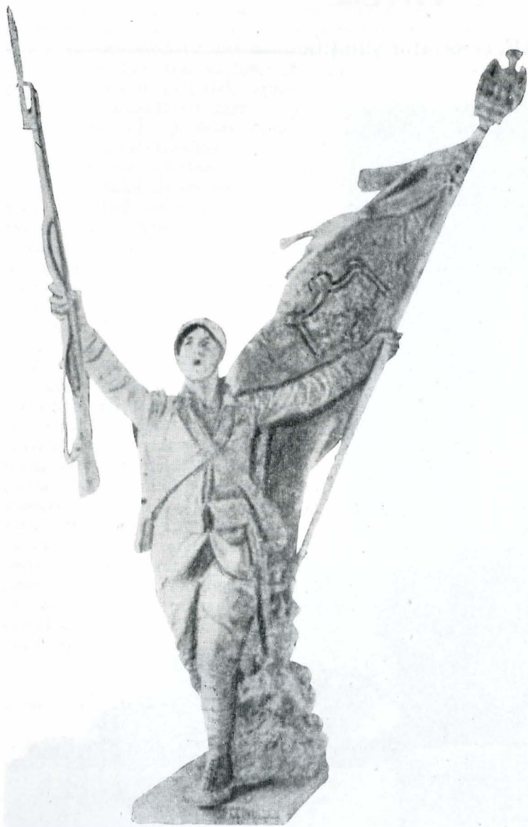
Fig. 2. Monumentul eroilor din Regimentul 21 Infanterie (1916—1918).

Pentru soldații români căzuți în străinătate „Cartea de aur” urma să fie ținută la legațiile sau ambasadele române.