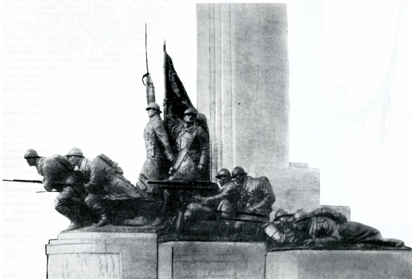
Fig. 1. Monumentul infanteriei, executat de Ion Jalea în 1936.

Monumentele istorice, amintitoare a unor fapte deosebite de eroism săvârșite de armata română pe câmpurile de bătălie, constituie unul din mijloacele importante în munca de educare a maselor largi și în special a tineretului, în spiritul eroismului, al dragostei față de patrie, al respectului față de cei care s-au jertfit pentru apărarea independenței și suveranității noastre naționale: „Să nu uităm niciodată că toate cuceririle de care ne bucurăm azi au fost obținute prin jertfa celor mai buni fii ai poporului nostru” 1 .