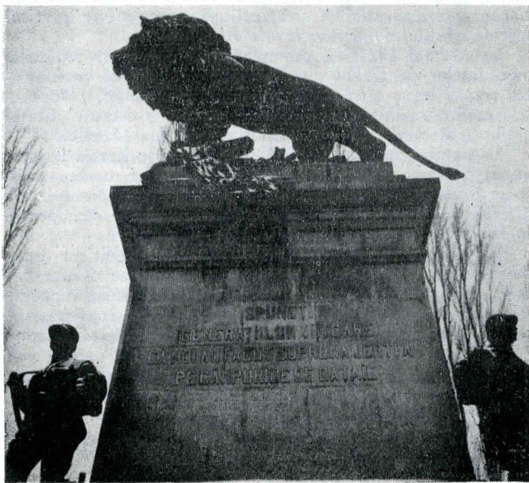
Fig. 3. Monumentul eroilor genului (1877—1878, 1916—1918).

dintii care a adus tot prinosul său de muncă la înfăptuirea înaltelor îndatoriri” 8 .