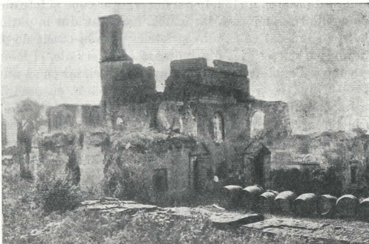
Fig. 2. — Casa din Herăști în 1954.

Cei doi frați, Căzan III logofăt și Udriște III paharnic, nu stăpînesc împreună mult timp casa, căci o vedem mai tîrziu proprietatea lui Căzan singur, care pe la anul 1700, după exemplul părintelui său, se gîndește să-și lase averea, încă în viață fiind, fiilor săi. Toate merseră bine pînă la casă. Erau 5 copii : doi băieți, Constantin și Nicolae și 3 fete : Maria, Ileana și Nedelea. Fetele ridicară și ele pretenții asupra casei, susținute fiind și de mama lor. Dar să lăsăm să grăiască pe bătrînul Căzan III, din al cărui act de donație al casei cităm : casele de piatră „care le am de la tatăl meu Căzan postelnic . . . care zicîndu-mi tatăl meu,