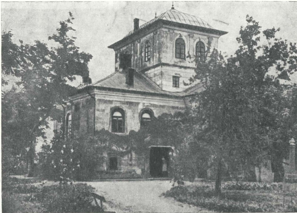
Fig. 1. — Casa din Herăști. Fotografie luată înaintea incendiului din ianuarie 1931. Apare turnul de cărămidă ridicat de Miloș Obrenovici.

Casa de piatră din Herăști, care formează obiectul studiului nostru, a fost construită în interiorul unui complex de locuințe și anexe mai vechi decât ea, dar care astăzi nu mai există 1 .