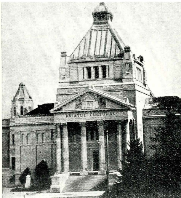
Fig. 1. — Palatul cultural. Muzeul regional Arad.