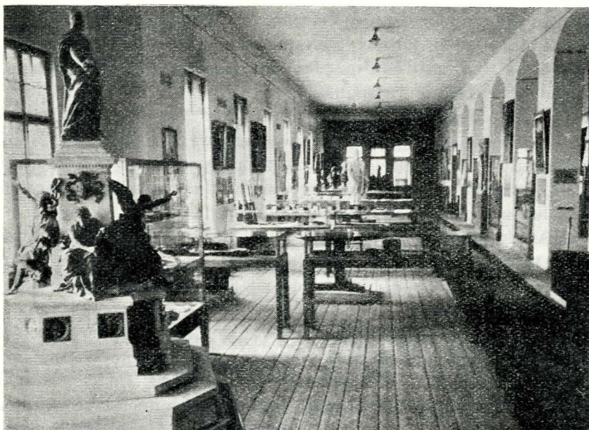
Fig. 2.—Aspect din cadrul „Muzeului revoluției 1848/49” din Muzeul regional Arad.