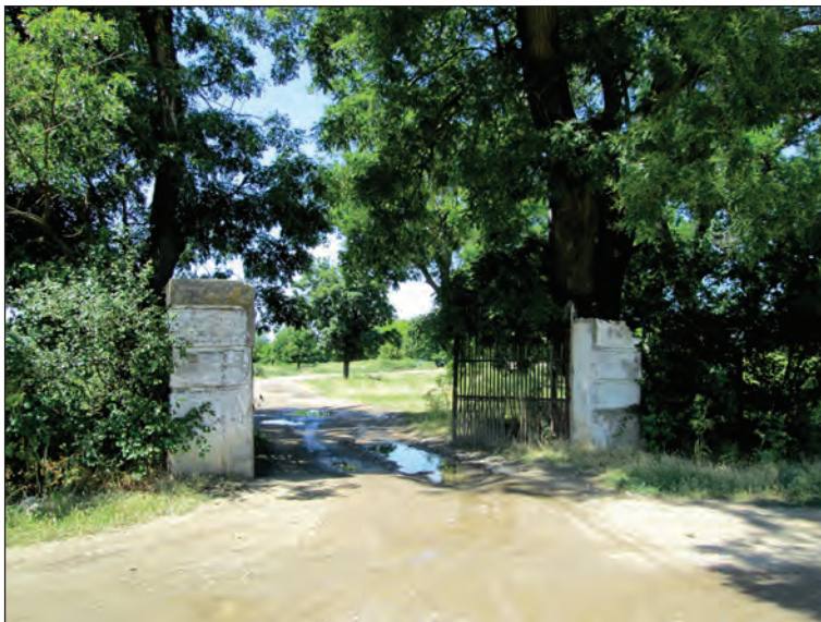
Fig. 16. Poarta principală de intrare