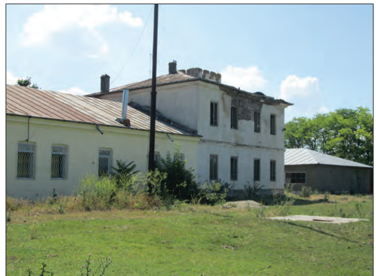
Fig. 13. Corpul lateral de sud, vedere din spate