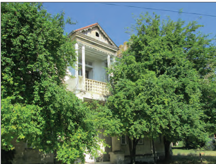
Fig. 10. Conacul conților de Roma, corpul lateral de nord