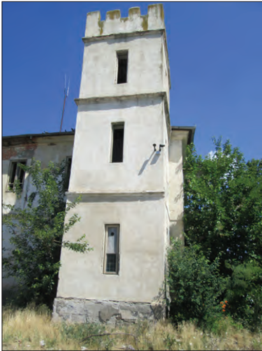
Fig. 14. Turnul de sud, vedere laterală