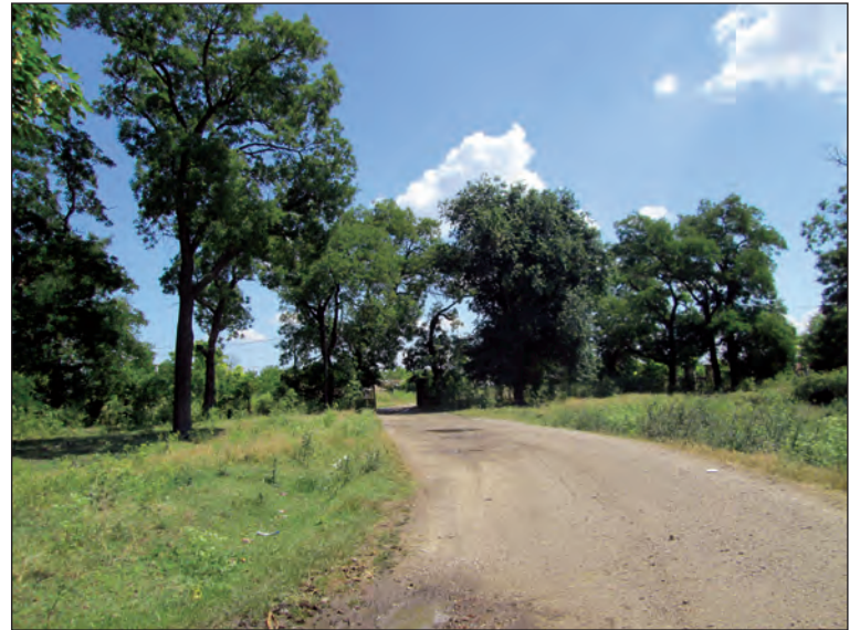
Fig. 15. Parcul și aleea principală