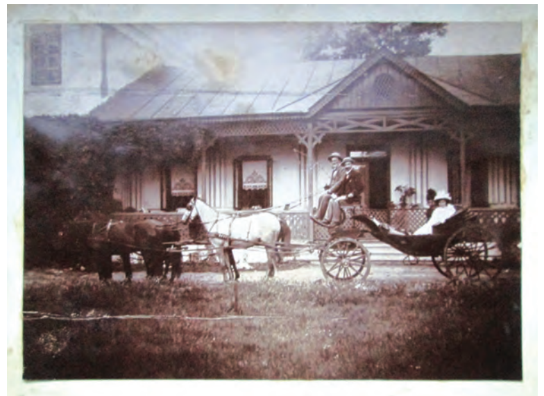
Fig. 7. Corpul central parter

Problema care se pune în corespondența purtată în acest caz era legată de prezumția statutului de monument al capelei. Cum aceasta nu fusese declarată monument istoric, iar funcțiunea nu era aceea de oficiere