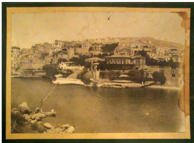
Fig. 3. Casa din Zante a conților de Roma, distrusă parțial la cutremurul din 1953, fotografie din arhiva G. Trohani.