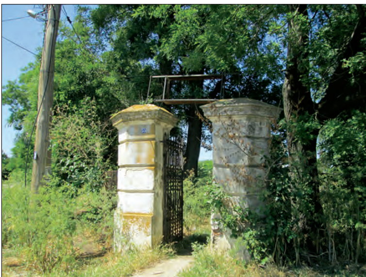
Fig. 17. Poarta secundară, pietonală

conacului de la Viziru, după plecarea familiei de Roma.