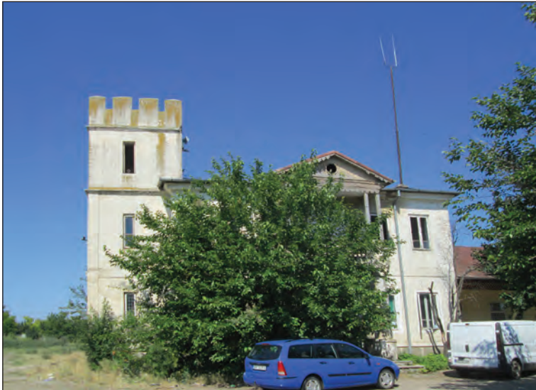
Fig. 8. Conacul conților de Roma, corpul lateral de sud