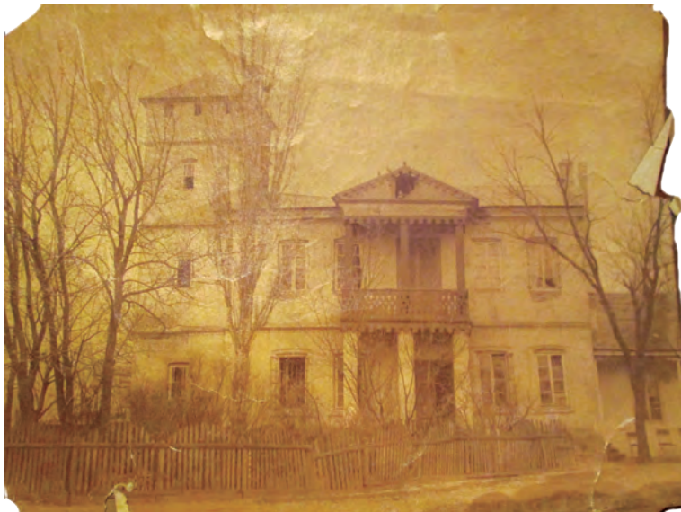
Fig. 6. Conacul conților de Roma, corpul de S și parțial cel central (fotografie din epocă prin amabilitatea dlui. George Trohani)

Față de fotografia de epocă se remarcă modificarea