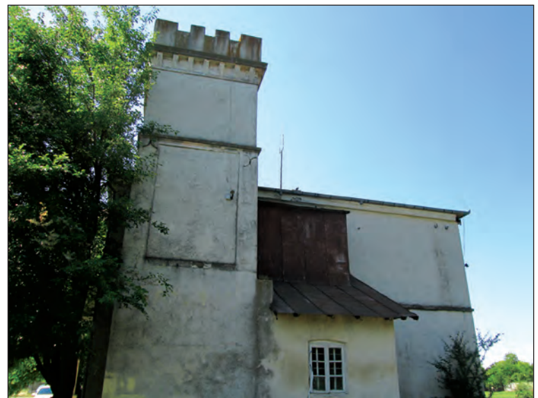
Fig. 11. Turnul de nord, vedere laterală