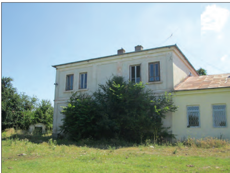
Fig. 12. Corpul lateral de nord, vedere din spate