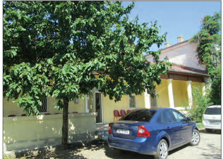
Fig. 9. Conacul conților de Roma, corpul central