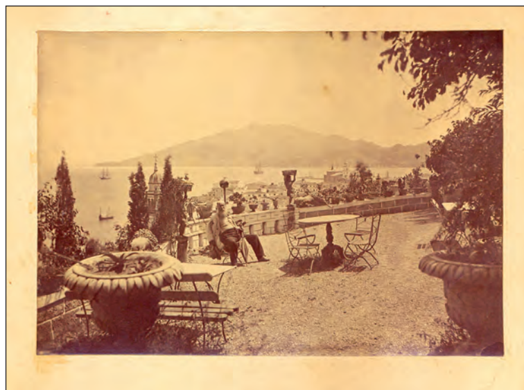
Fig. 4. Terasa casei din Zante